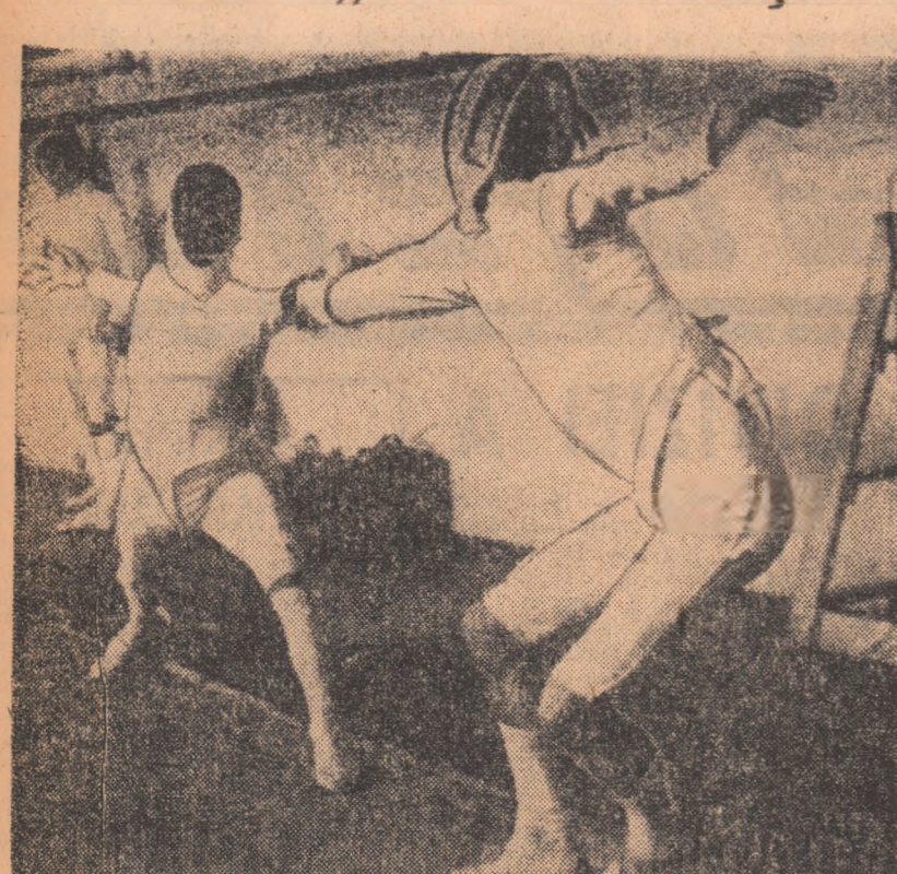
Un asalt din meciul spadasilor. Pe planșă: reprezentanții echipelor Steaua și Medicina Cluj...