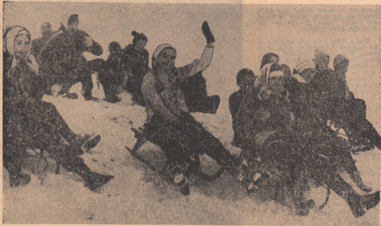
Zboară sănăună, zboară! Pe derdeluș, la Păuleni-Ciuc, au început concursurile pentru „Cupa tineretului”

Comuna Păuleni-Ciuc, cu satele Dornia și Șolmeni, numără 1700 de suflete. Comună mică, dar înstărită, cu oameni harnici, buni gospodari și, mai ales, plini de ambii. Pe ce ne înțelegem afirmările? Bineînțeles, pe fapta și spre convingere vi le împărtășim pe cele legate direct de obiectul preocupării noastre, de sport.