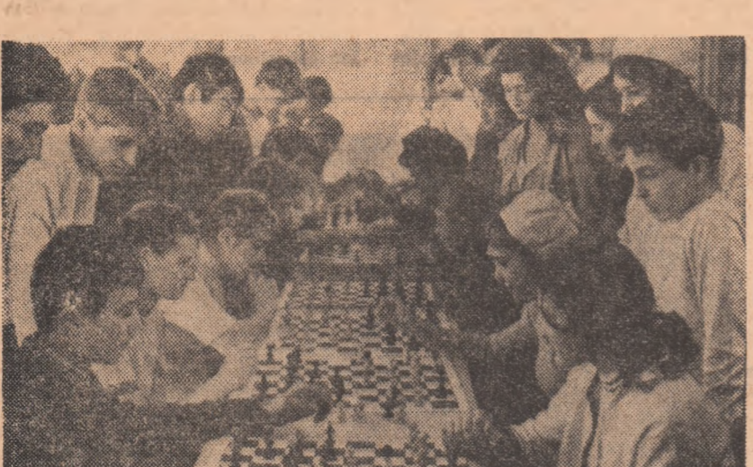
În lipsa zăpezii, șahul ține „capul de afiș” al „Cupei tineretului”. Iată o imagine de la întrecerile organizate recent de clubul „Voința” din Capitală.