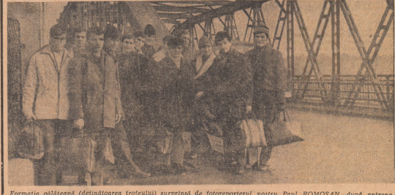
Formația gălățeană (deținătoarea trofeului) surprinsă de fotoreporterul nostru Paul ROMOȘAN, după antrenamentul efectuat joi dimineața, în sala Giulești.

BOX-CLUB GALAȚI - BOX-CLUB BRĂILA ȘI FARUL CONSTANȚA - A.S.A. CLUJ