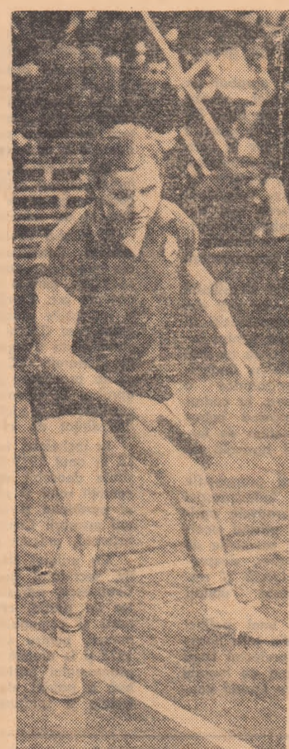
Maestra emerită a sportului și campioana lumii, Maria Alexandru, continuă să intruchipeze speranțele iubitorilor tenisului nostru de masă în sezonul competițional internațional 1974

Anul 1974 și următorii vor pune tenisul de masă românesc în fața unor importante obiective de înde-plinit pe tărîmul sportului de per-formanță. Numai în primele șase luni ale lui 1974, sportivii noștri vor fi chemați să participe la trei competiții de amploare: campiona-tale Internaționale ale României de la Ploiești (20—22 ianuarie), Tur-neul primelor 12 jucătoare de pe continent — prin Maria Alexan-dru (10—12 februarie, în Suedia), și campionatele europene de seniori la șapte probe (6—13 aprilie, la Novi Sad, în Iugoslavia); mai tirziu, în-tre 29 iulie și 6 august, în R. F. Germania vor avea loc campiona-tale de juniori ale Europei. Iată tot atîtea întreceri internaționale de mare anvergură la care se așteaptă o prezență prestigioasă din partea reprezentanților României. De alt-fel, hotărîrea Federației C.C. și F.C.B. din 28 februarie — 2 mar-tie 1973 este absolut clară în a-ceastă privință: „...Vor fi luate măsuri pentru afirmarea pe plan internațional a echipelor românești la jocurile sportive — handbal, fot-bal, volei, tenis de cîmp, polo, hock-ey, tenis de masă, rugby, popice, șah...”