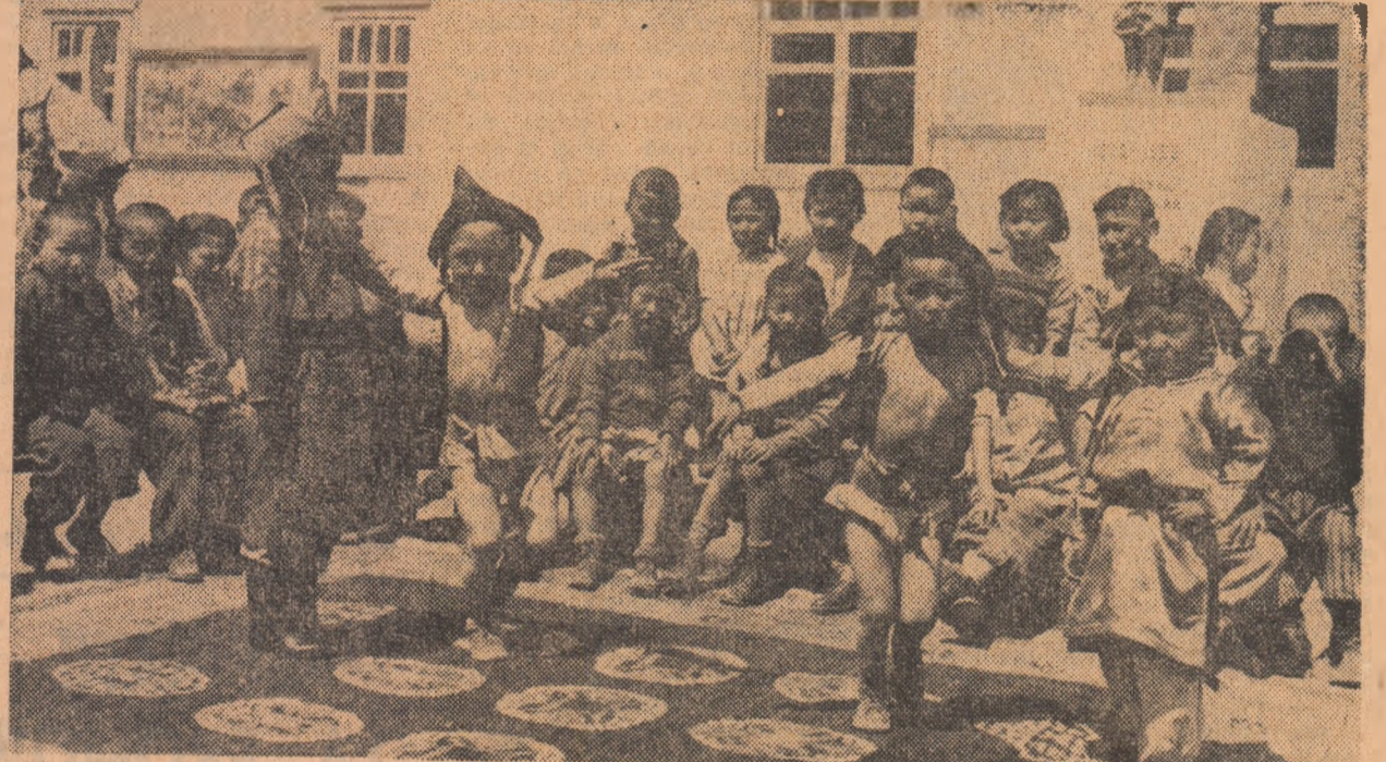
R. P. MONGOLĂ: Acești copii de grădiniță din R. P. Mongolă vor deveni cu siguranță sportivi. Din cea mai fragedă vîrstă ei fac cunoștință cu salteaua de lupte, sînt considerați inițiați în această disciplină. În acest an, ca și în cel precedent, s-au organizat, în sute de localități, întreceri de lupte pentru pionieri, în care antrenorii și arbitri nu au fost alții decît părinții acestor copii.

Sub numele de „Bumbarasa”, care amintește un celebru cîntec studentesc, va fi construită în orașul Tomsk, o nouă bază sportivă, cuprinzînd diferite terenuri și o clădire cu patru etaje, cu săli destinate practicării mai multor sporturi, printre care în primul rând boxul și luptele, foarte populare la tineretul din această îndepărtată regiune albertină. Încăpînd cu proiectul și continuînd cu toate lucrările manuale, construcția noului baze este opera studenților Institutului politehnic, cărora li s-au adăugat membrii asociațiilor sportive.