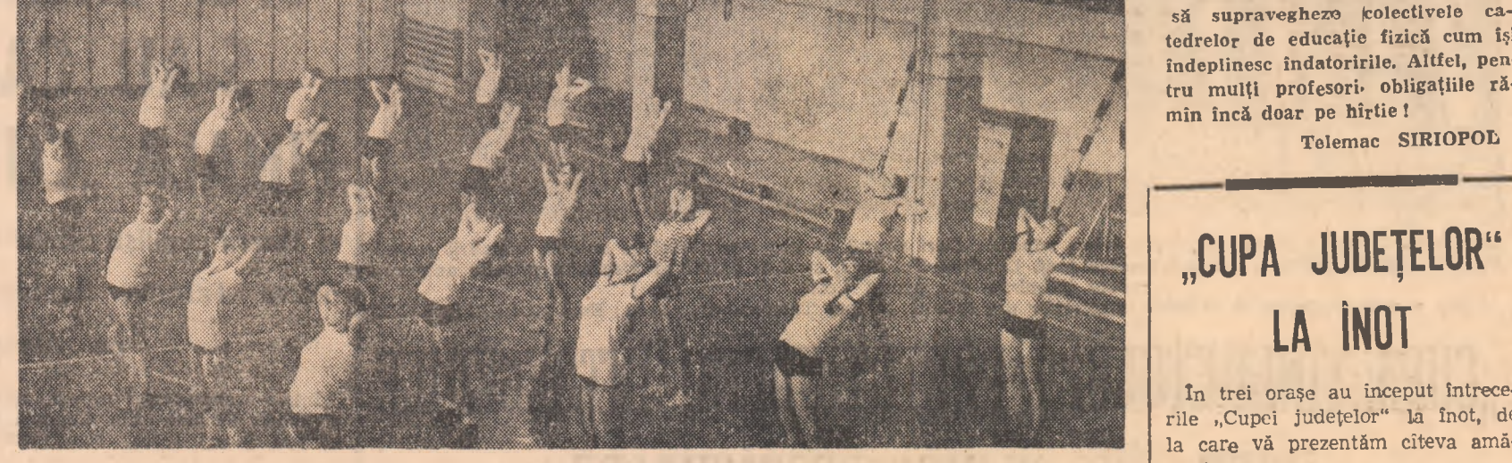
Liceul nr. 2 din Reghin este frecventat de aproape 1400 de elevi. Un liceu în care studiul se desfășoară la o înaltă înălțime și care s-a făcut remarcat în dispuștile din cadrul fazei județene, apoi la finalele pe țară ale campionatelor școlare...