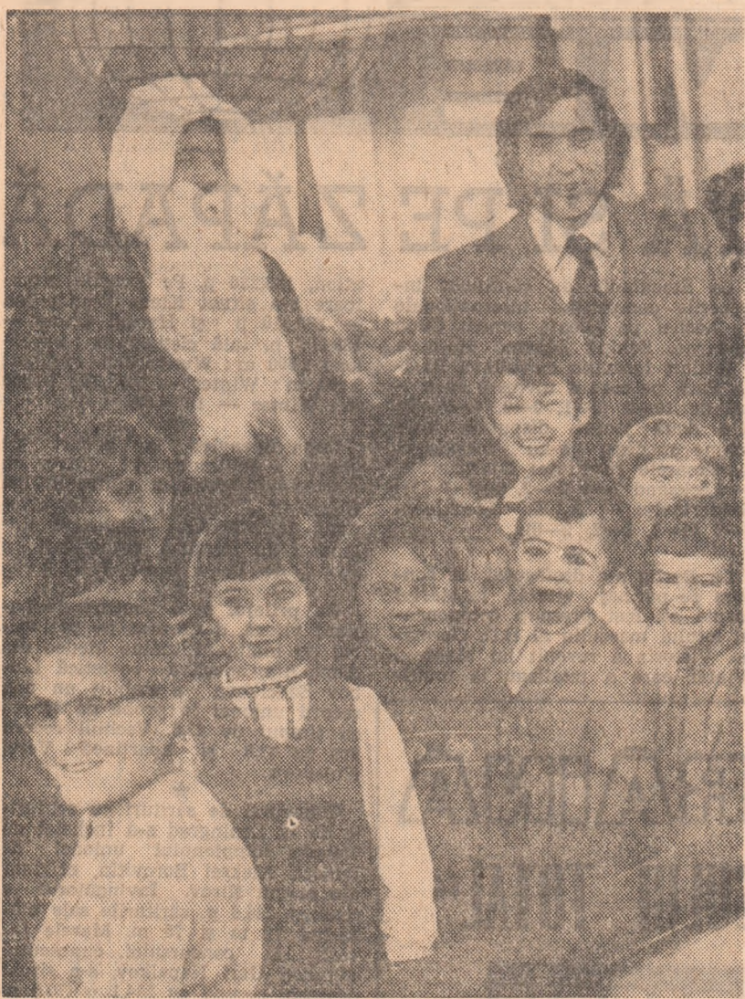
Un dar de Anul Nou: Ilie Năstase și Moș Gerilă fotografiați în micul locușor salariaților C.N.E.F.S.