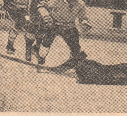
Fază din meciul dintre Sparta Praga (jucători cu tricouri închise) și Slovan Bratislava, disputat în cadrul campionatului cehoslovac de hochei și încheiat cu scorul de 5-2 în favoarea primei echipe.