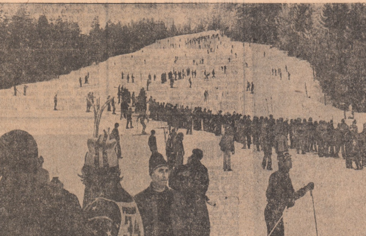
Pirtele albe — tentație irezistibilă de a te avînta în zborul pe schiuri, la întrecere cu păsările și cu tine însuși!...