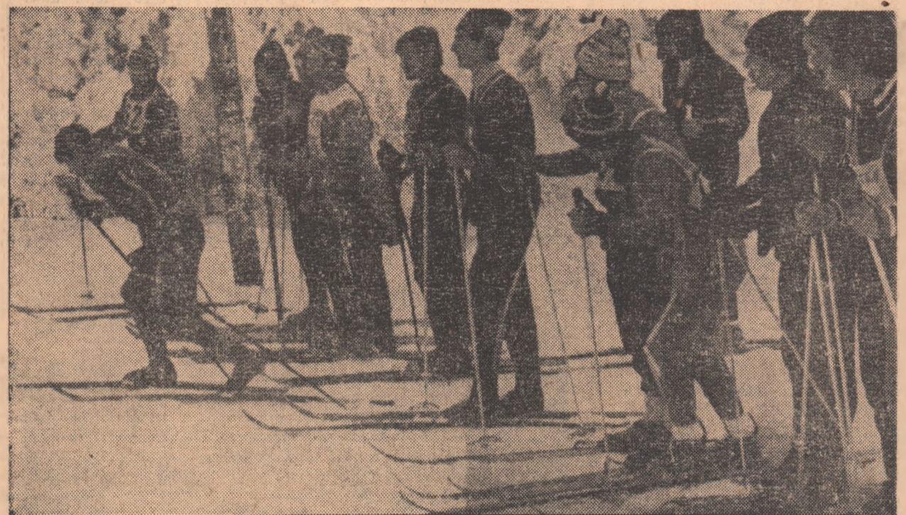
Mai sint citeva momente pînă la startul uneia dintre cursele de schi din cadrul „Cupei Tineretului”, programate în aceste zile pe pîrțile vacanțelor școlare de iarnă.