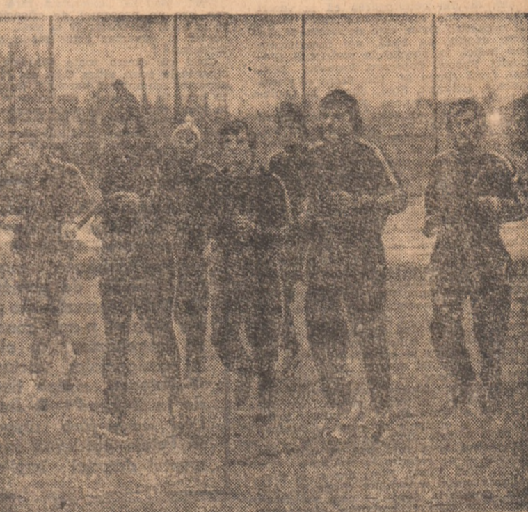
Tată-i pe fotbalistii de la Sportul studentesc la primul antrenament în aer liber din acest an. O scurtă încălzire după care ei vor intra în plin efort.