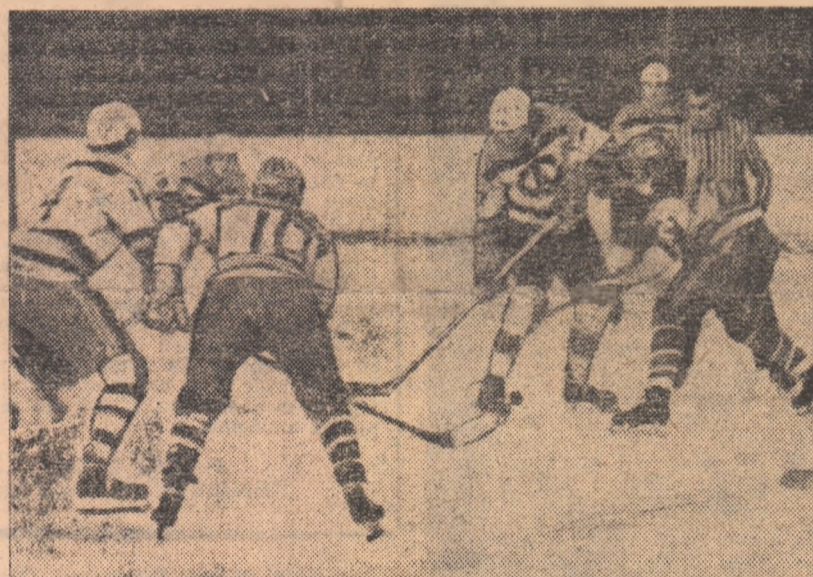
Dispută aprigă pentru puc între hocheiștii de la Agronomia Cluj și I.P.G.G.

Disputate la Galați, Miercurea Ciuc, și București, partidele revanșă ale etapei campionatului de hochei au purtat, mai pregnant decît primele întîlniri, amprenta echilibrului, a Bucureștii și Galați mcurile de la București și în special caracterizate printr-un mare consum de energie. Iată scurte relații de la partidele de serie.