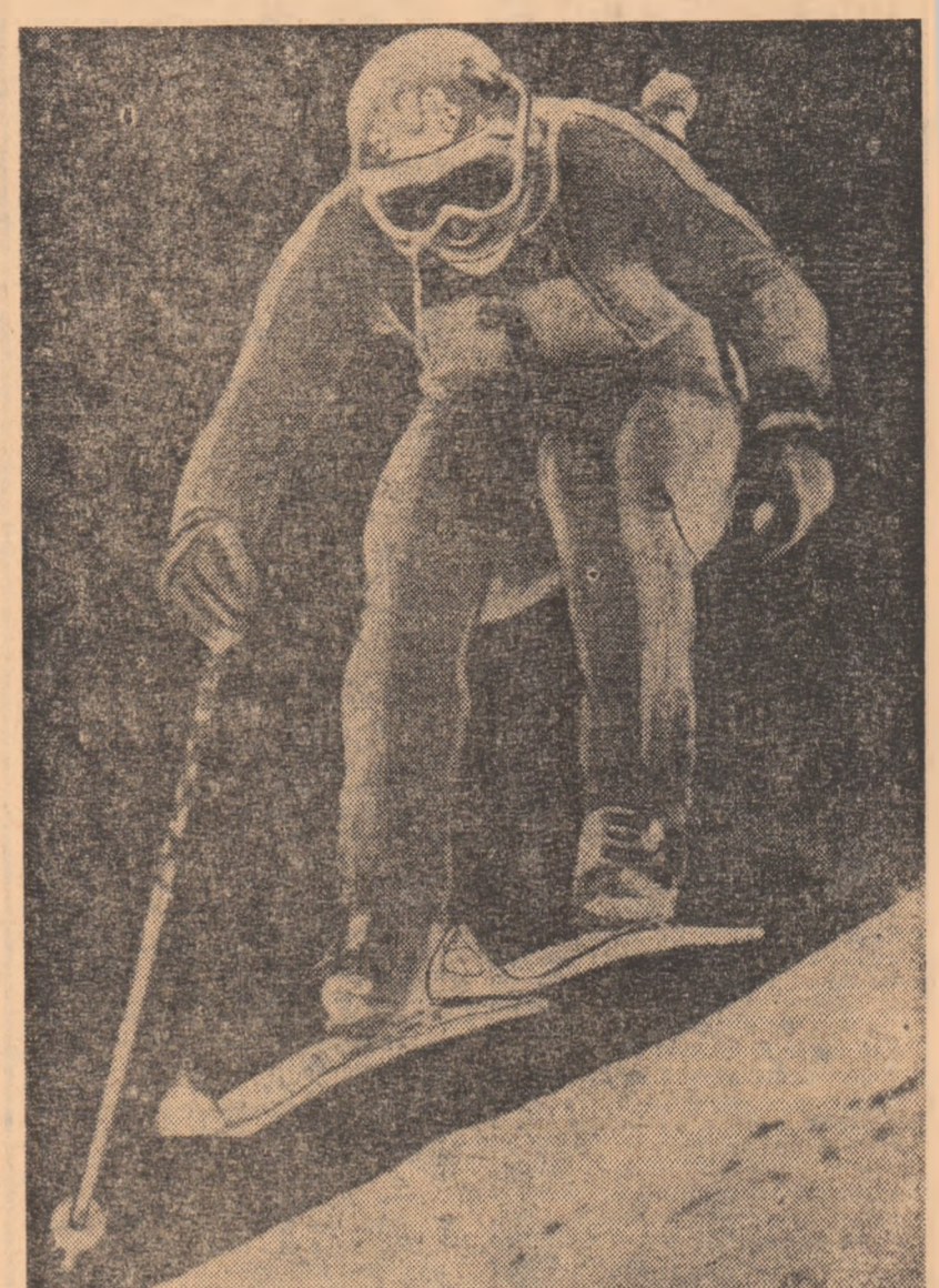
Elvețianul Roland Collombin la prima sa victorie anul acesta: în coborîrea de la Garmisch Partenkirchen.