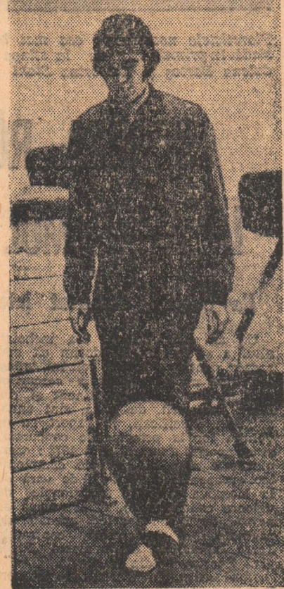
Moment de virtuozitate Ateni, jucătorul reîntregit de curînd lotului stelist

„La sfîrșitul ei, duminică 20, îl completează antrenorul Constantin, avem în proiect un joc la două porți, cu Dinamo, pe terenul stadionului Municipal. Și,