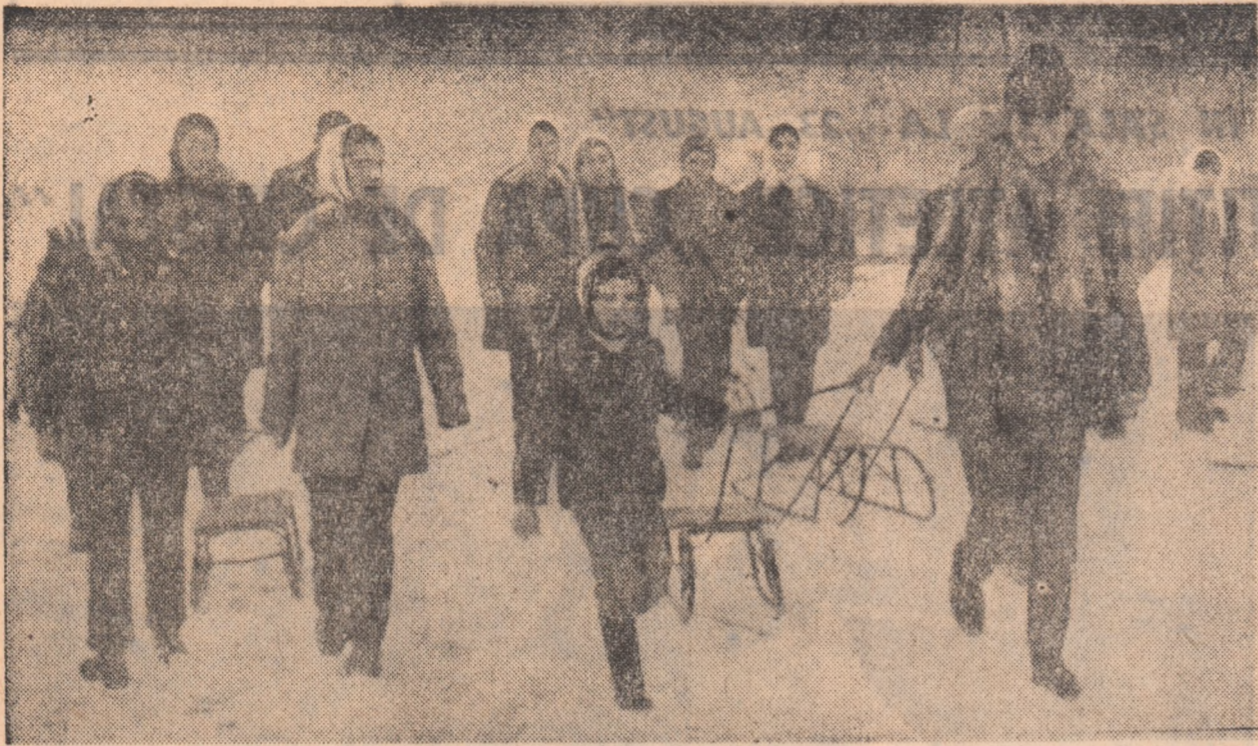
Tineri din comuna Comana la unul dintre „antrenamentele” efectuate in vederea etapei pe localitate la sanius.