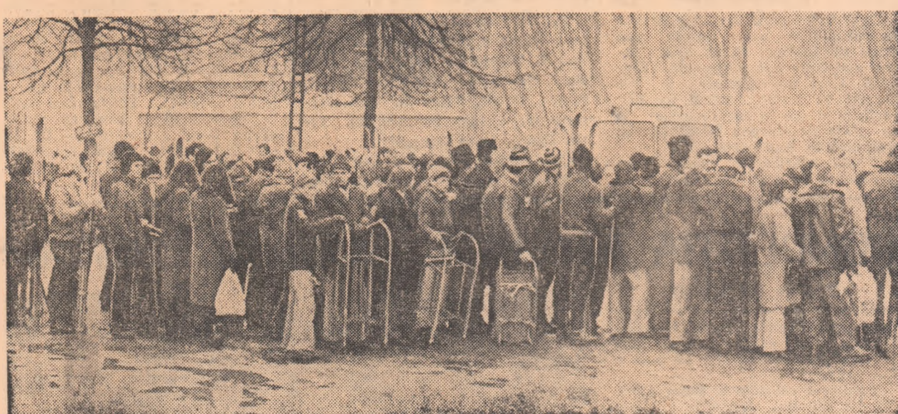
Pentru a ajunge la locul de start participanții la întrecerile din cadrul „Cupei tineretului” fac... coadă la autobuzul de Poiana Brașov.