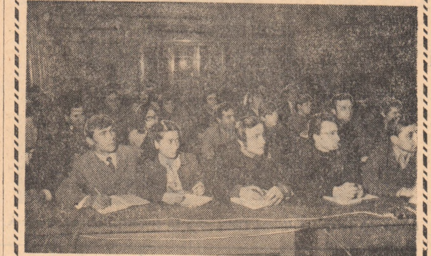
Aspect din timpul unei ore de curs la radioclubul din Galați

femei, oameni de diverse profesii, animați de dorința a cunoaște cît mai multe din tainele radioamatorismului și electronicii moderne. Mai adăugăm că la radioclub au avea loc în curînd un nou e-