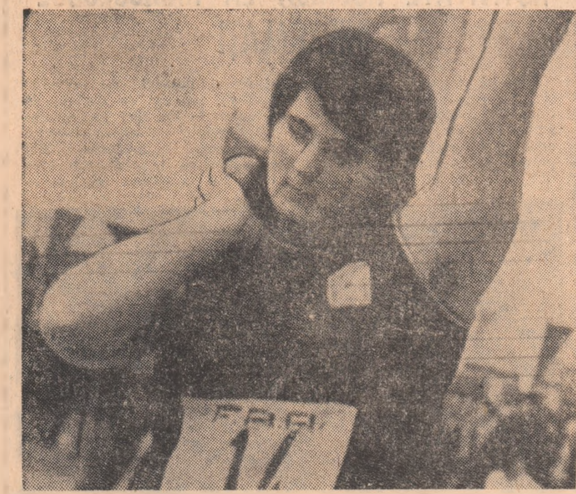
Campioana europeană Helena Fibingerova își pregătește o nouă aruncare.