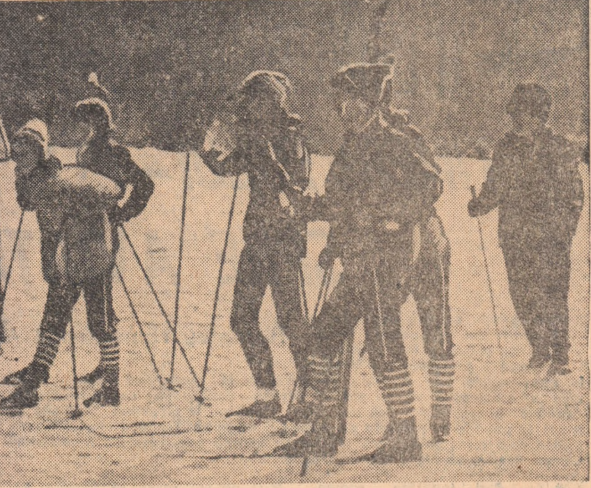
La fiecare sîfșir de săptămîna sute de schiori se întrec în numeroase competiții prevăzute în etapa de iarnă a „Cupei tineretului”. Iată un grup de concurenți în așteptarea startului, la Poiana Brașov