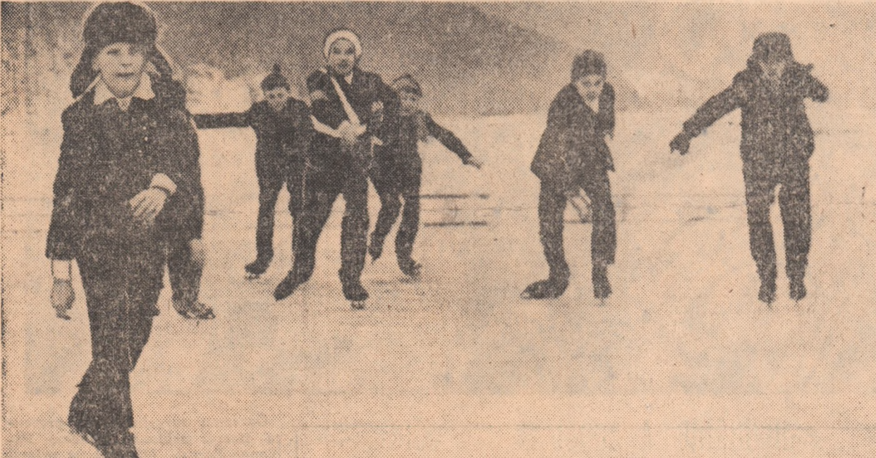
Pe patinoarul zonei de agrement „Lunca Moldovei” din orașul Gura Humorului.