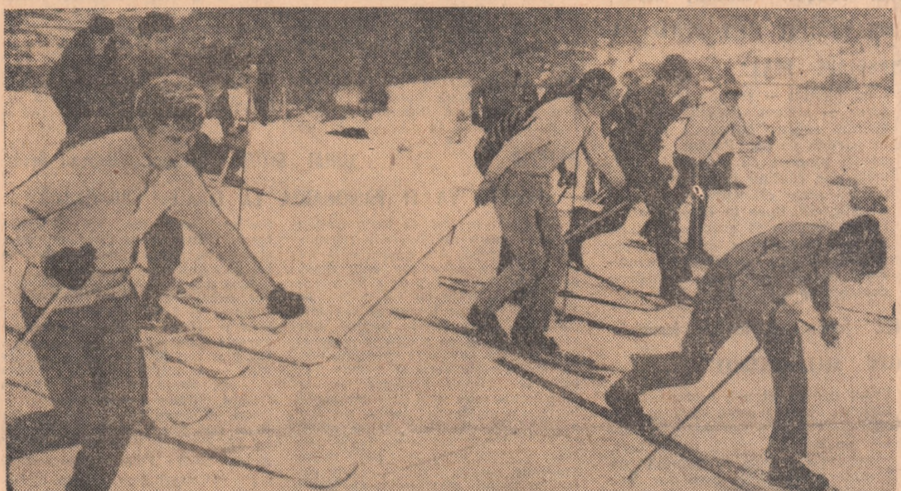
Pe pîrțile de la Sonata se întrec concurenții pentru etapa județeană Mureș, la schi. Foto: Andrei LUCA — Cluj

Întrecerile se încheie duminică. D. DIACONESCU-coresp. jud.