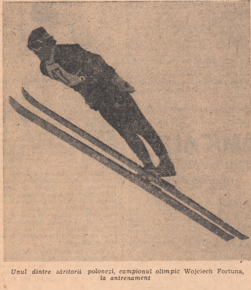
Unul dintre săritorii polonezi, campionul olimpic Wojciech Fortuna, la antrenament

Astăzi se deschid la Falun (Suedia) campionatul mondial de schi (probe nordice), la care vor participa peste 350 de concurenți din 31 de țări.