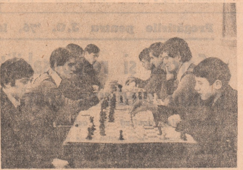
Intreceri de șah la „Grivita Rosie”, în cadrul „Cupei C.F.R.-Istului”

Si acum, despre a doua parte a titlului: Față de numărul mare al salariatilor cuprinși în regionala C.F.R. Cluj — foarte multi dintre ei membri ai asociatiei — majoritatea dornici să practice una sau alta, ori cîteva discipline — se simte nevoia unei baze sportive. Cei spiriți Consiliului Central al U.G.S.R., al Consiliului sindical județean, precum și cu ajutorul direct al comitetului de partid și al comitetului sindicalului, anul trecut a fost inaugurat un stadion, de fapt o adevărată bază sportivă complexă.