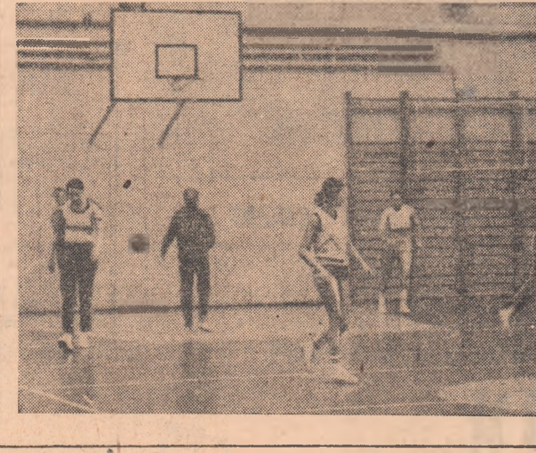
Raid onchetă realizat

Hotărîrea Plenarei C.C. al P.C.R. cu privire la dezvoltarea continuă a educației fizice și sportului a pus în fața mișcării noastre sportive obiective de mare responsabilitate, atît în direcția întăririi sănătății întregii mase de cetățeni, cit și în cea a reprezentării cu cinste a culorilor românești în competițiile internaționale. Această din urmă datorie a organizațiilor sportive sau a celor cu atribuții în domeniul sportului, subliniată de documentele de partid, a fost analizată temeinic și cu prilejul recentei plenare a Consiliului Național pentru Educație Fizică și Sport. S-a precizat astfel că îndeplinirea importantelor sarcini care stau în fața sportului nostru de performanță necesită eforturi mereu sporite pentru îmbunătățirea procesului instructiv-educativ, creșterea volumului și calității pregătirii în concordanță cu cerințele actuale, pe plan internațional, întărirea simțului de răspundere, de dăruire și devotament, stimularea pasiunii și exigenței întregului activ al mișcării sportive. În acest context, un rol important și s-a atribuit folosirii judicioase și integrale a bazei materiale de care dispune sportul de performanță. În ce măsură și cum sînt utilizate bazele sportive? Este o întrebare la care redactorii noștri au încercat să găsească răspunsul asistînd la antrenamente, vizitînd bazele sportive din Capitală dimineața, după-amiază și seara.