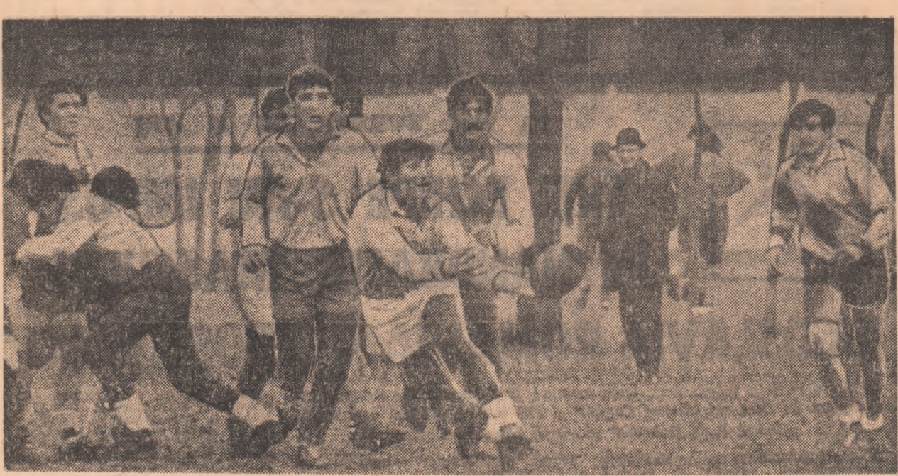
Rugbyștii juniori au început pregătirile pentru apropiatul campionat european, susținând un prim joc-școală cu divizionara B, Ojeulul.