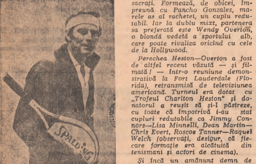
Charlton Heston, gata pentru un „duel” în fața fileului.