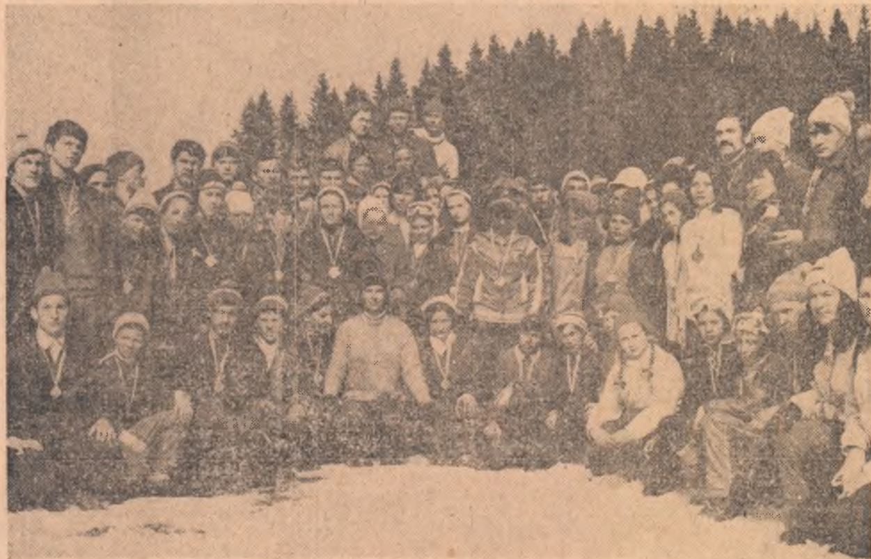
O amintire plăcută pentru sportivii medaliați la toate probele finale ale „Cupei tineretului”