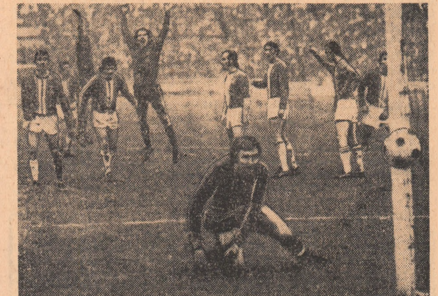
Hoeness și Beckenbauer (Bayern München) cu brațele ridicate să bucure după golul egalizator. Fază din meciul Werder Bremen — Bayern München (1-1).

Iată, cum au fost programate unele partide. 13 martie: R.D.G. — Belgia; 15 martie: Haiti—Uruguay; 22 martie: Haiti—Uruguay; 23 martie: Franța—ROMÂNIA; 27 martie: R.D.G.—Cehoslovacia; R.F. Germană—Scotia; Olanda—Austria; 28 martie: Haiti—Zair; 30 martie: Haiti—Zair; 3 aprilie: Portugalia—Anglia; 7 aprilie: Brazilia—Cehoslovacia; 13 aprilie: Bulgaria—Cehoslovacia; 14 aprilie: Haiti—Chile; 17 aprilie: R.F. Germană—Ungaria; Belgia—Polonia; BRAZILIA—ROMÂNIA; Iugoslavia—U.R.S.S.; 18 aprilie: Haiti—Chile; 21 aprilie: ARGENTINA—ROMÂNIA; 24 aprilie: Bulgaria—Albania; 28 aprilie: Cehoslovacia—Franța; Brazilia—Irlanda; 1 mai: R.F. Germană—Suedia; El-