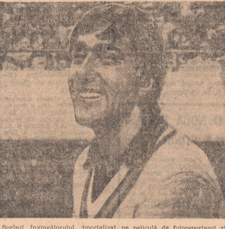
Surisul învingătorului, imortalizat pe pelicula de fotoreporterul ziarului american „The Richmond News Leader”