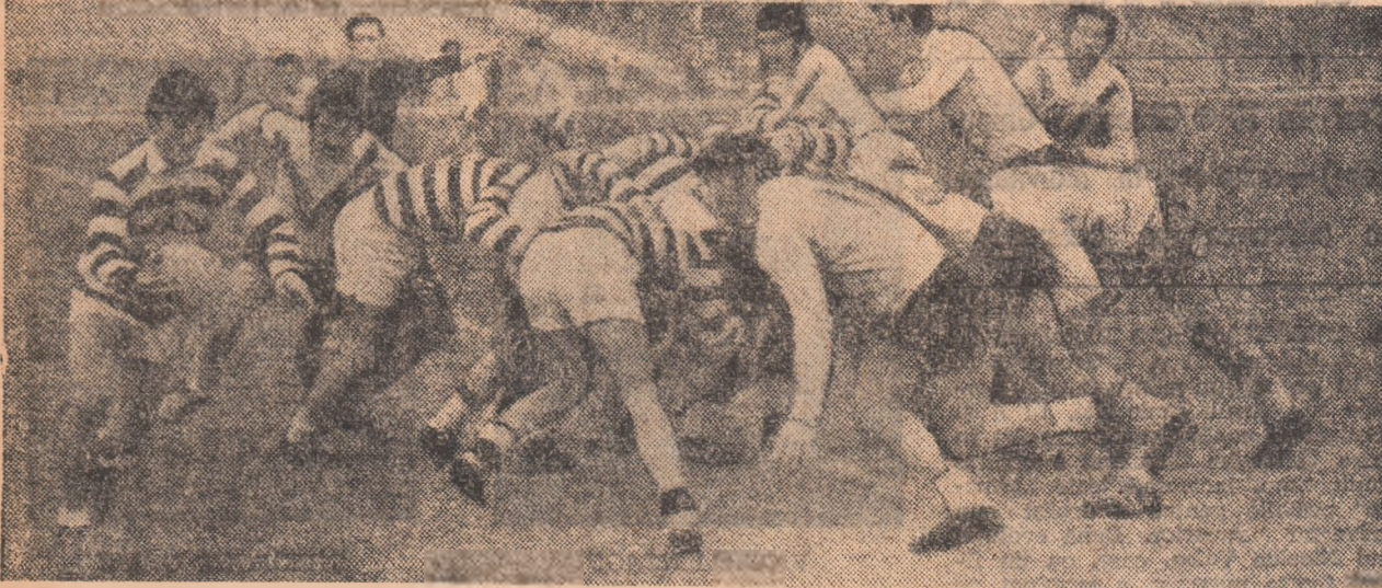
Atac lansat de Sportul studentesc, după o grămadă ordonată, va fi oprit, din nou, de rugbyștii de la Politehnica Iași

Arbitrul R. Chiriac a condus bine următoarele faze: