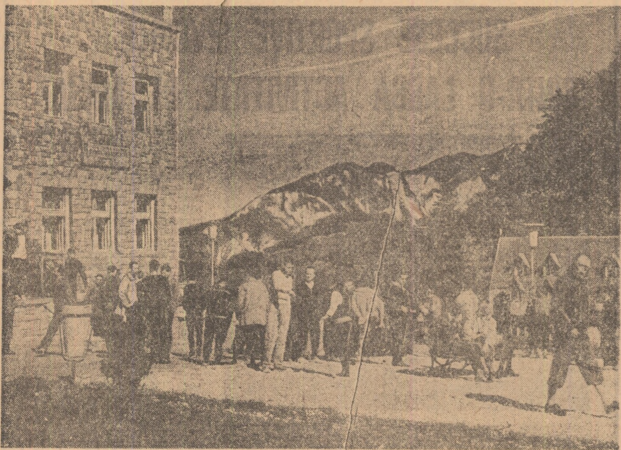
Fotoreporterul nostru a avut șansa de a prinde pe peliculă în această primăvară destul de capricioasă o zi plină de soare. Reunite după drumetii efectuate în împrejurimi, grupurile de excursioniști se află, deocamdată, într-o binemeritată pauză, în fața clădirii principale din cadrul complexului de cabane de la Piriul rece.