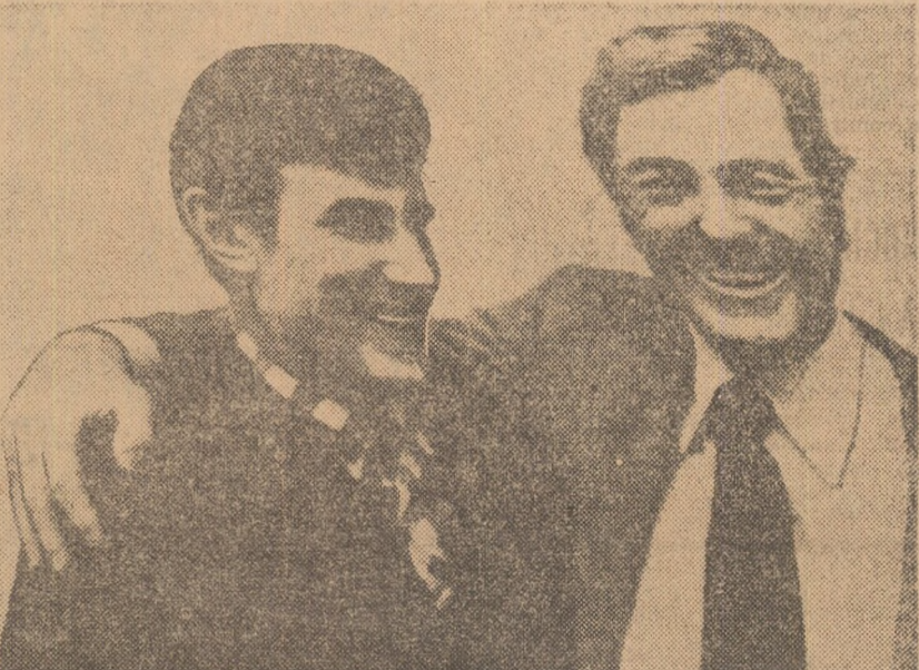
Fostul „rege al decatonului”, americanul Bob Mathias (în dreapta), acum în vîrstă de 43 de ani, fotografat împreună cu actualul recordman mondial al celei mai dificile probe atletice, sovieticul Nikolai Avilov, cu prilejul unei întâlniri pe care cei doi mari campioni au avut-o recent la Moscova.