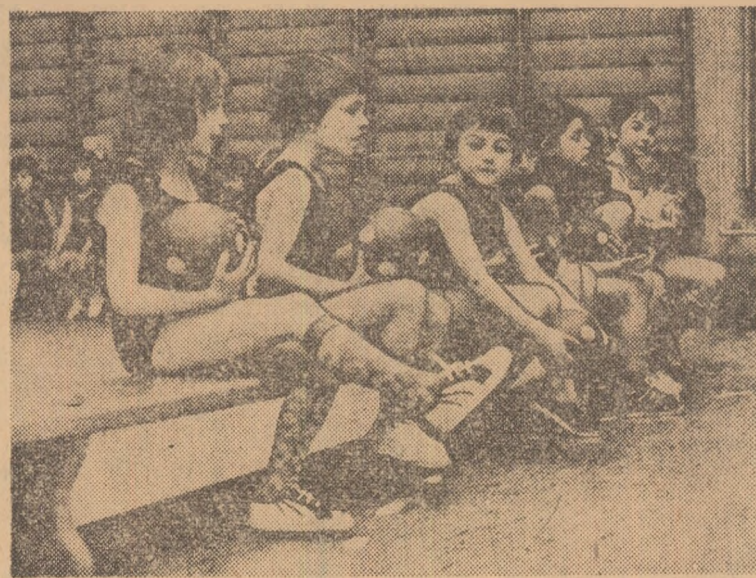
Copiii de astăzi, practicând exercițiile fizice în sălile de gimnastică, sint viitorul sportului de performanță în Republica Populară Ungară