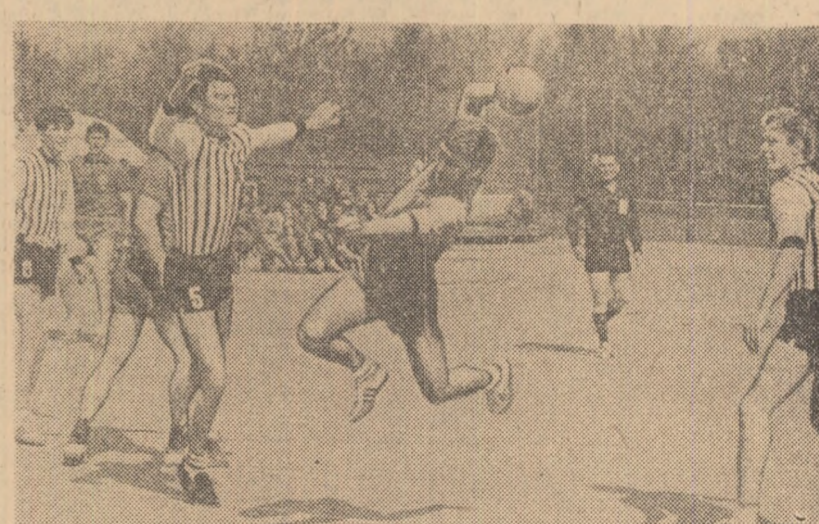
O aruncare spectaculoasă și... gol! Autor Cristian Gațu. (Fază din meciul disputat ieri între Steaua și Universitatea Cluj)

Ieri s-a disputat, pe terenul de la complexul sportiv Steaua, în „matineu” (este de neînțeles cum, în țara campionilor mondiali, o partidă din prima divizie a țării poate fi programată într-o zi de lucru, la ora 10 dimineața), meciul de handbal de divizia A dintre formațiile masculine STEAUA și UNIVERSITATEA CLUJ (restanță din etapa a II-a). Cîțiva spectatori ocazionali (oare, în viitor, ne putem aștepta și la meciuri programate între miezul nopții și zori?) au asistat la o partidă „amicabilă”, la un foarte bun antrenament al campionilor, încheiat cu... scorul de 18-13 (8-5).