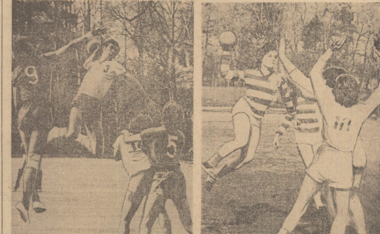
Doă faze din primele meciuri finale la handbal: I.E.F.S. — Institutul de Mine din Petroșani (băieți) și Politehnica București — A.S.E. București (fete)

CLUJ 24 (prin telefon). O splendidă zi de primăvară. Iată cadrul în care au fost programate majoritatea partidelor din Parcul sportiv studentesc și Stadionul Municipal — aflate, la această dată într-o adevărată explozie de culoare. Adușingînt entuziasmul și ambiția competitorilor reliefaș, credem, ambanța în care au debutat finalele universitare ale ediției de vară a „Cupei tineretului”.