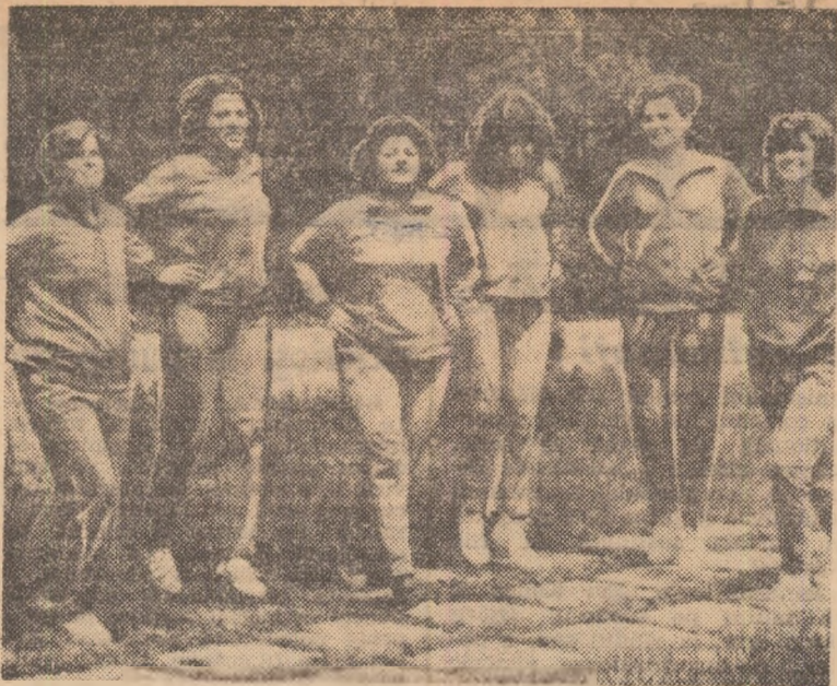
Pentru o mai bună condiție fizică, componentele lotului feminin fac zilnic asemenea exerciții