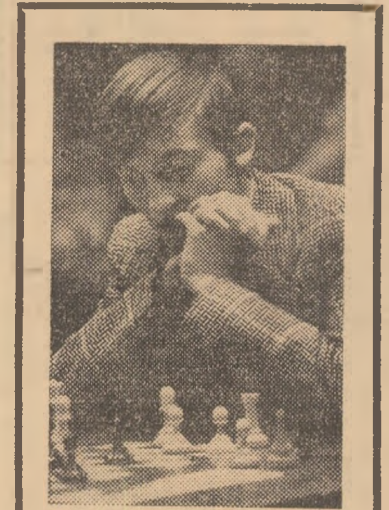
În cursul lunii septembrie Anatoli Karpov îl va întâlni pe Viktor Korcnoi într-un meci care va desemna pe viitorul adversar al actualului campion mondial, Robert Fischer (S.U.A.). Născut la 5 mai 1951, la Zlatoust (Ural), Anatoli Karpov (în imagine) s-a afirmat de cîțiva ani ca a mare speranță a șahului sovietic. În meciul cu Spasski, câștigat cu 4-1, tinărul mare maestru a dat dovadă de o forță de joc deosebită. Experții compară stilul lui Karpov cu cel al fostului campion al lumii, cubanezul José Raul Capablanca.

Luni este zi de odihnă, iar marți se dispută etapa a VII-a pe ruta Szczecin — Neubrandenburg, 145 km .