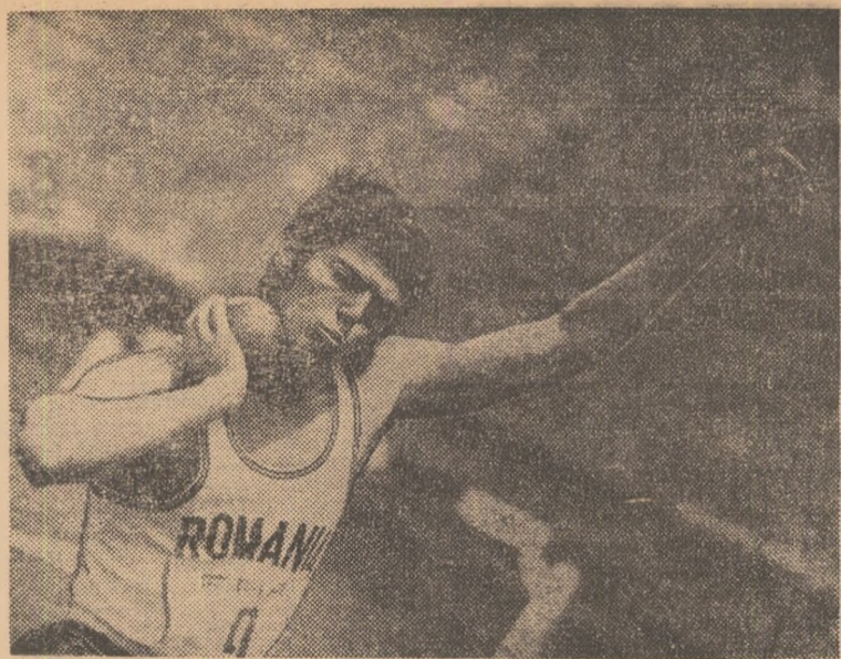
Recordmanul țării noastre evoluează în proba de aruncarea greutății.