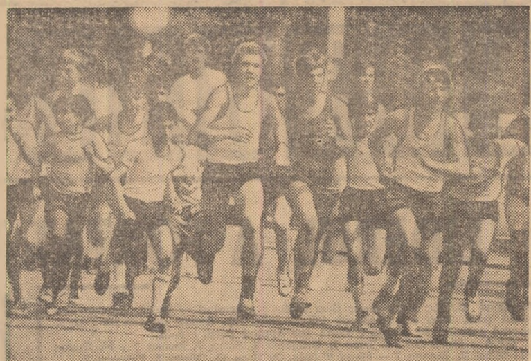
Aproape 100 de concurenți au luat startul în cursa de alergare la categoria de vîrstă 11-14 ani și toți au parcurs întregul traseu