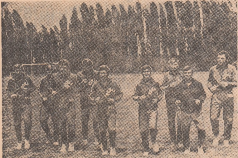
În peisajul minunat al bazei sportive de la Snagov boxerii din lotul republican se pregătesc pentru balcaniada și... mondiale