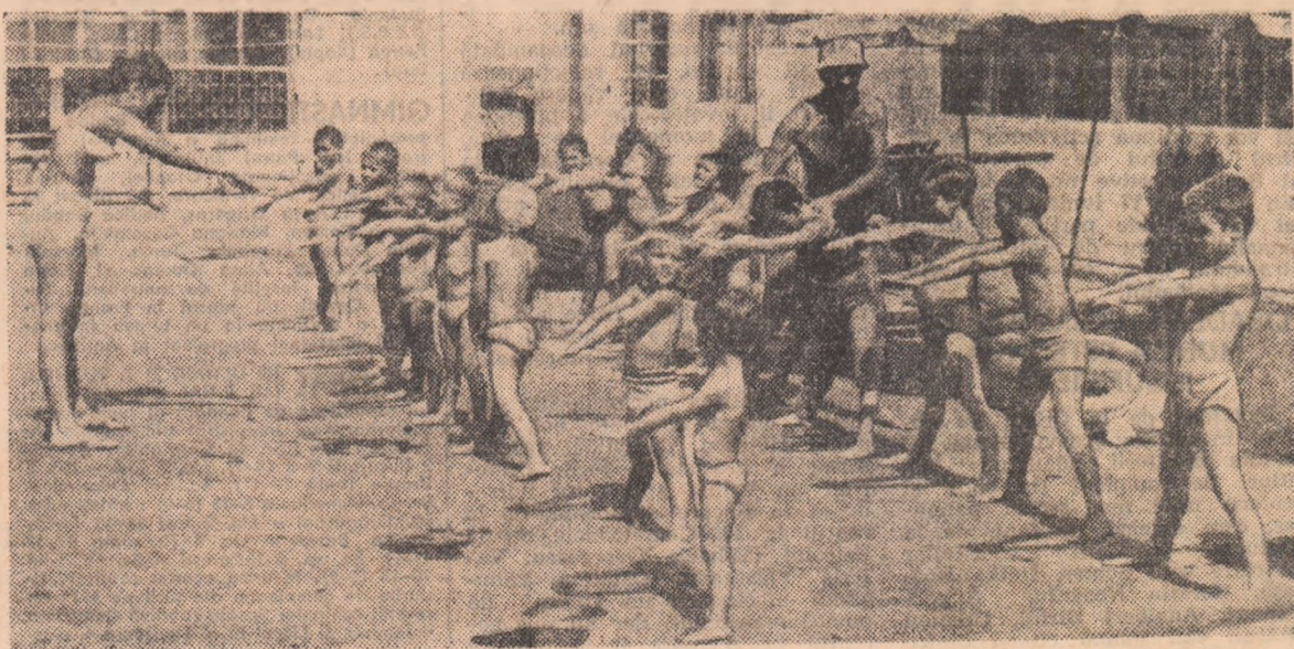
O lecție de înot începe... pe uscat, ne demonstrează una din grupele centrului de la strandul Obor.