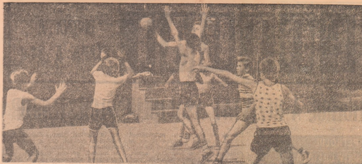
La „Cireșarii” — moderna bază sportivă a elevilor și tineretului din sectorul 8 — în timpul unei lecții de inițiere în handbal

În funcțiile de vicepreședinți ai C.J.E.F.S. au fost aleși reprezentanți ai unor instituții și organizații de masă cu atribuții în domeniul sportului.