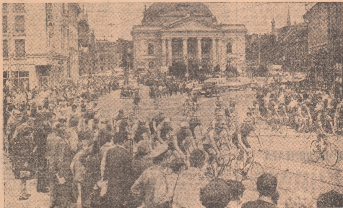
Orășele țării trăiesc din plin marea sărbătoare sportivă pe care o oferă Turul ciclist al României. Ieri, mii și mii de orădeni au condus la plecare spre Timișoara plutonul celor 53 de cicliști.