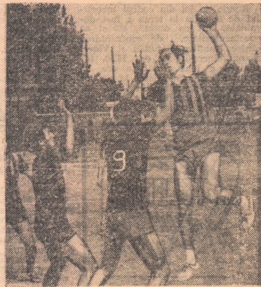
O imagine de la antrenamentele de ieri ale handbaliștilor

Toți vroiau să lase impresia că sînt foarte calmi. Dar era o aparență. Simplu fapt că acești băieți și aceste fete venite pentru trei zile la București, la o finală de competiție republicană, unde reprezintă sutele de mii de tineri din toată țara, care s-au