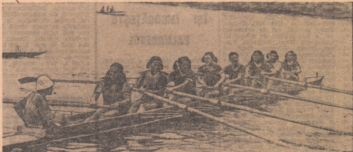
Echipajul de 8+1 al României, laureat la cea de a 12-a ediție a „Regatei Snagov”, la cîteva minute după victoria de duminică