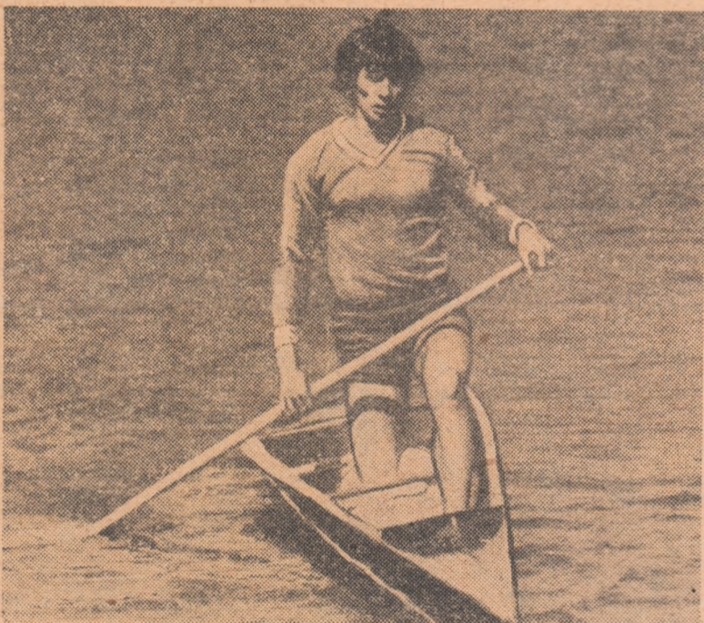
Ivan Patzaichin, „prima canoe“ a țării

Iată programul celor trei zile de concurs: vineri (de la ora 9 și 15,30) — serii și recalificări în probele de 1000 și 500 m; sîmbătă : de la ora 9 — semifinalele în probele de 1000 m (B) și 500 m; de la ora 15,20 — finalele probelor de 1000 m; duminică : de la ora 9 — semifinalele în probele de 500 m, de la ora 14 — finalele în probele de 500 m și în cursele de fond.