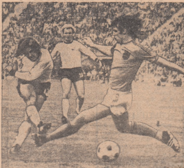
Virful de atac al reprezentativei R. F. Germană, Gerd Müller, în stînga, înscrie golul victoriei echipei sale în finala de ieri a ediției jubiliare a C.M.

MARIO ZAGALO (Brazilia): „Pentru noi, care am cîștigat de trei ori titlul mondial, locul trei nu ar fi însemnat nimic. În schimb, pentru polonezi este un titlu de glorie. Am pierdut de data aceasta, s-a mai întîmplat și cu alte echipe, dar sînt convins că Brazilia va recuceri „Cupa Mondială”. Pasiunea brazilienilor pentru fotbal este nestînsă. La noi există foarte mulți tineri talentați, care vor fi încercați în meciuri internaționale cît de curînd”.