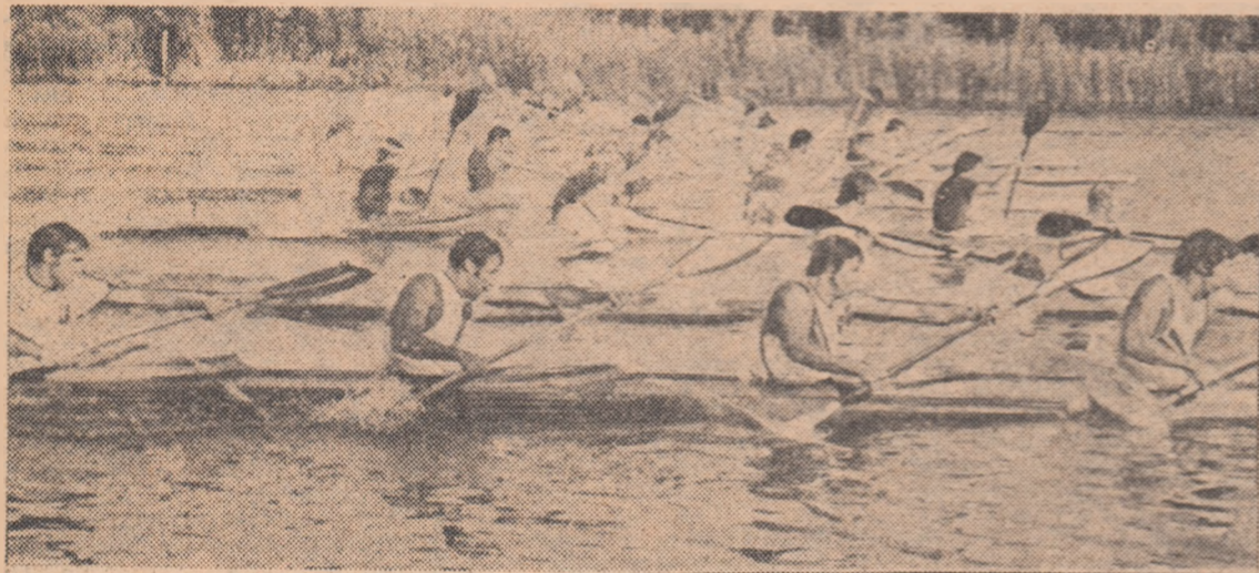
Start spectaculos în proba de caiac 4 — 1000 m