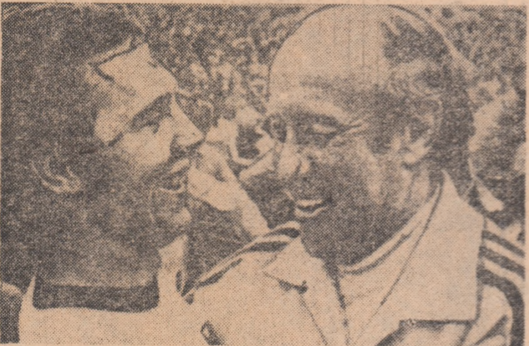
După încheierea meciului final, antrenorul reprezentativei campioane a lumii, Helmut Schön și căpitanul formației cîștigătoare, Franz Beckenbauer, se îmbrățișează, fericiți

În ansamblu echipa Olandei a făcut un joc mai bun decît partenera sa de întrecere în această finală. Ceea ce le-a lipsit olandezilor pentru a obține victoria a fost calmul în repriza secundă, dar aceasta nu înseamnă că putem ignora marea putere de luptă a gazdelor, superioritatea lor în ceea ce privește, mai ales, concepția de joc în atac. Pentru că în timp ce olandezii au plimbat