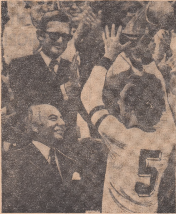
După ce a primit din mâinile președintelui R. F. Germania, Walter Scheel, noul trofeu cu care F.I.F.A. a dotat întrecerea celor mai bune echipe de fotbal din lume, căpitanul echipei învingătoare, Franz Beckenbauer, arată spectatorilor Cupa lumii, cucerită la această ediție de reprezentativa R. F. Germania.

așa cum apreciază toată lumea aici, unul dintre cele mai frumoase momente din istoria acestui turneu de vîrf. Contribuția învingătorilor, alături de aceea a învingătorilor, nu trebuie omisă. Sub aspectul fotbalului deplin, într-adevăr, această „cucerire“ R. F. Germania—Olanda a reprezentat un meci remarcabil, chiar dacă el nu a avut secvențele dramatice ale finalei de la Londra din 1966, sau pitorescul fotbalului brazilian la finala de la Ciudad de Mexico.