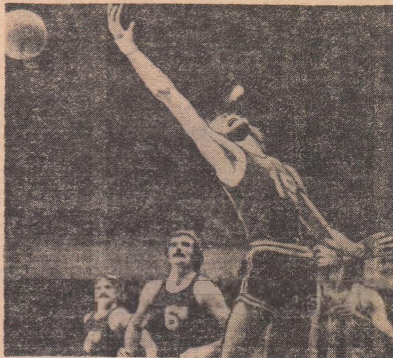
Luptă sub panou în meciul Iugoslavia — Brazilia (84—60) desfășurat la San Juan

La San Juan (Porto Rico) s-au disputat primele meciuri din cadrul turneului final al campionatului mondial de baschet (m).