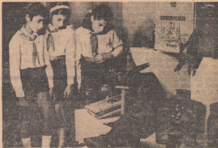
Pionierii, primii admiratori ai exponatelor culese de participanții la expedițiile „Cutezătorii”...

Ieri a avut loc la Palatul Pionierilor din București vernisajul expoziției republicane a expedițiilor „Cutezătorii”. Manifestarea a fost dedicată de către organizatori — Consiliul Național al Organizației Pionierilor — și de către temerarii excursioniști, celor două evenimente politice de însemnătate majoră ale anului, a XXX-a aniversare a Eliberării și Congresul al XI-lea al partidului.