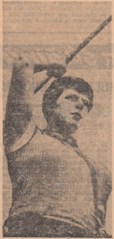
Mihaela Penes, cîștigătoare de medalii olimpice de aur în proba de aruncare a suliței la Tokio.

În aceste direcții se canalizează toate eforturile de viitor.