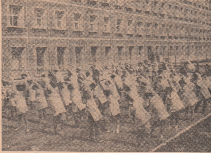
Pauză de odihnă activă la Spitalul unificat din Galați.

În acest context larg, fiecărei mame îi revine obligația de a călăuzi primii pași ai copilului pe calea exercițiului fizic și a mișcării, pentru dezvoltarea lui armonioasă, spirituală și trupească. Dar, pentru femeia însăși, indiferent de vîrstă sau de ocupație, educația fizică și sportul reprezintă surse de prospețime și vigoare, mijloace de menținere a sănătății și frumuseții, de ridicare a capacității de muncă, a potențialului său biologic.