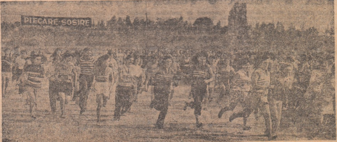
Alergarea pe distanțe medii, o disciplină accesibilă și mult agreată de tineretele fete.

sale, Partidul Comunist Român a considerat emanciparea femeii ca unul din obiectivele importante ale luptei pentru lichidarea exploatarea omului de către om, pentru înlăturarea marilor transformări revoluționare, a avut permanent în atenție atragerea femeilor în activitatea generală a națiunii, pentru reconstrucția