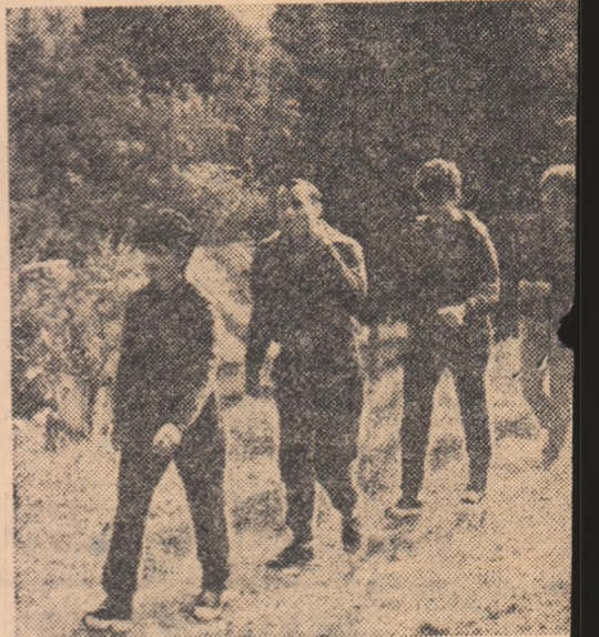
În cursul anului 1973 au fost organizate — aproape 100 000 de acțiuni turistice cu participanți

Marea anvergură pe care au luat-o educația fizică și sportul de masă, faptul că ele cuprind — în mod sistematic sau ocazional — aproape un sfert din populația țării și tot mai mulți copii, tineri și tinere, a necesitat, ca și în alte numeroase domenii, descentralizarea acestei activități, mutarea ponderii ei în unitățile de bază, asociațiile și cluburile sportive. De altfel, din acest punct de vedere, Hotărîrea de partid arată: „Sindicatul, organizațiile de tineret și asociațiile sportive din întreprinderi și instituții vor extinde formele de practicare a exercițiilor fizice, organizarea de activități sportive, turistice și întreceri pentru cucerirea titlului de fruntaș pe unitate în diferite ramuri sportive, care să cuprindă MASA LARGĂ A SALARIAȚILOR , baza activităților constituind-o ATELIERUL, SECȚIA, SECTORUL ” (s.n.).