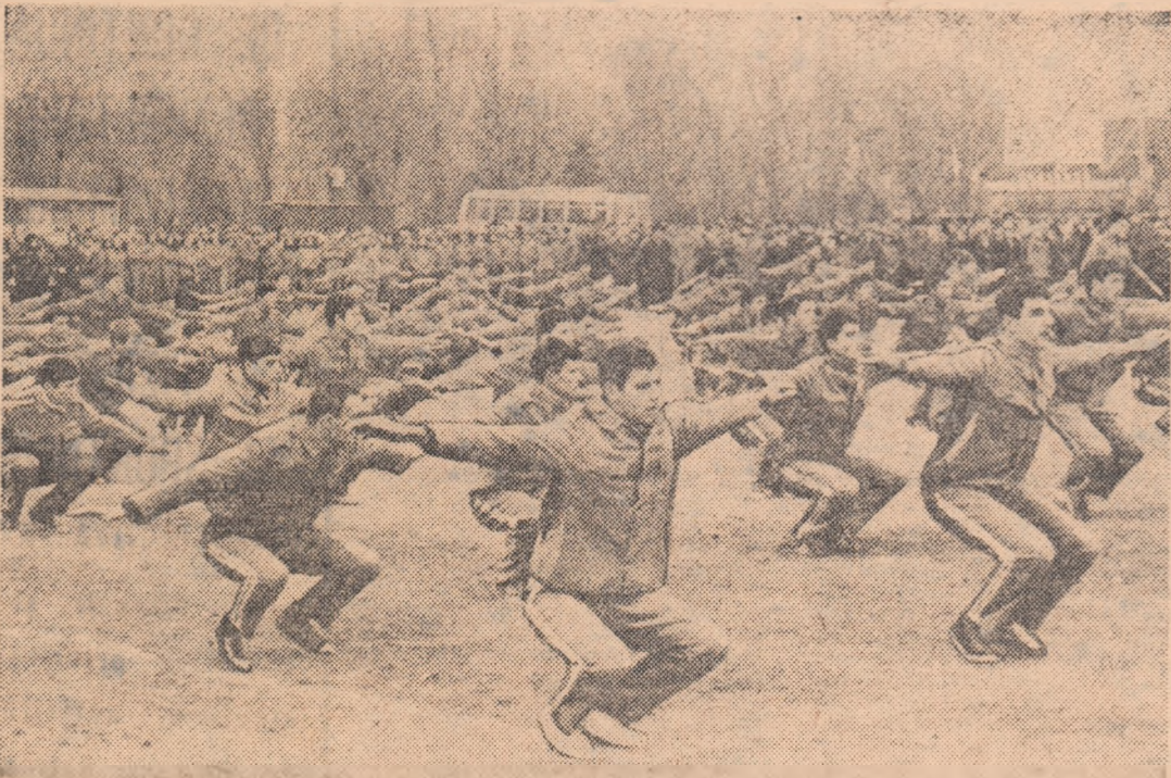
Conform indicațiilor Hotărîrii de partid, capătă o extîndere tot mai mare lecțiile de educație fizică desfășurate în aer liber. Iată un aspect de la o „oră-model” prezentată de elevii Grupului școlar energetic din Capitală

D epușăm politica, pe țul nostru a zătoare, ob UNOR REZU GIME CERU SE ALINIEZ DE OAMENI DE A Cu aceste tive acum, viață liberă, forum al co Satisfacție desigur, just la automulț