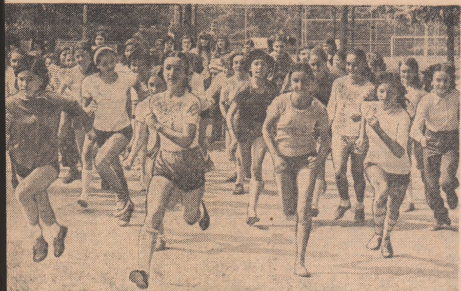
Prezintă forma cea mai largă și accesibilă de practicare a sportului

și cu dorința de a munci pentru propășirea sportului în unitatea respectivă, prin instaurarea principiilor muncii colective și — mai ales — prin întărirea rolului conducător al organelor și organizațiilor de partid, care au primit sarcini concrete în această direcție prin Hotărîrea Plenară C.C. al P.C.R. din februarie-martie 1973, în care se subliniază: „Organele și organizațiile de partid au obligația să sprijine conducerea organizațiilor sportive, cluburilor și asociațiilor, organizațiile obștești și de stat pentru a-și îndeplini întocmai atribuțiile și sarcinile ce le revin, să exercite un control permanent asupra mișcării sportive în vederea ridicării acestora la nivelul înaltelor exigențe ale societății noastre”.