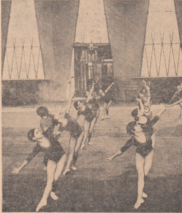
La Liceul cu program de educație fizică din Orașul Gheorghe Gheorghiu-Dej se ridică o nouă pleiadă de talente gimnaste

Formele organizatorice ulterioare ( Comitetul pentru Cultură Fizică și Sport , în perioada 1949—1957, Uniunea de Cultură Fizică și Sport , 1957—1967, iar astăzi Consiliul Național pentru Educație Fizică și Sport ) au fost determinate de progresul întregii noastre societăți, de înaintarea neabătută pe drumul edificării socialismului, operă la care mișcarea sportivă era chemată să-și aducă permanent aportul. Dezvoltarea impetuoasă a forțelor de producție, generalizarea noilor relații de producție și continuarea lor perfecționare, victoria definitivă a socialismului la sate, schimbările petrecute în structura socială din România au reclamat, și pe tărîm sportiv, forme organizatorice, modalități și soluții funcționale noi, originale, superioare. În pas cu realitățile din țara noastră. A fost marele merit al partidului nostru de a le fi căutat și găsit, de a le fi adaptat la necesitățile obiective ale României.