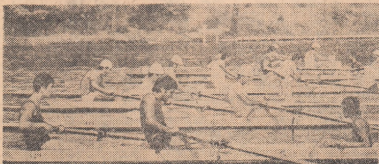
Start în proba de 2+1 a juniorilor II

În primul rând ne vom opri asupra participării record, folie de concurs consemnând 466 de tineri schifști. Din 23 de secții. Subliniem acest lucru pentru că de la an la an cifra juniorilor prezenți la întrecerile republicane sporește vertiginos, fapt ce dovedește, în esență, munca tot mai susținută a antrenorilor în direcția atragerii cât mai multor copii spre sportul viselor și ramelor a asigurării unei largi baze de selecție. În plus, vom remarca și amănuntul, deloc neglijabil că selecția s-a dovedit, în general bună, recent încheiată ediție a campionatelor aducându-ne în față numeroși canotori tineri, foarte bine dotați fizic. Trezind la bilanțul întrecerilor trebuie să arătăm de la bun început că din cele 23