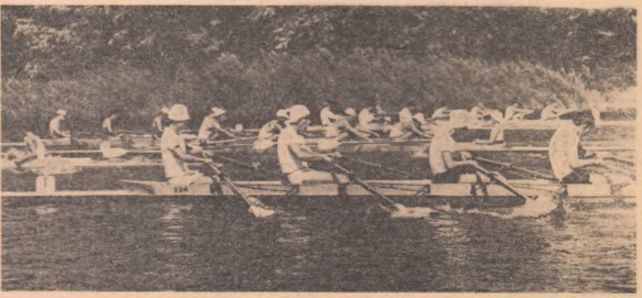
Canotajul, un sport al celor viguroși, îndrăgit de mii de tineri și tinere din țara noastră

Dar, pe răbojul timpului anii s-au așternut unul după altul și astăzi, după trei decenii de la Eliberare, sub conducerea partidului, mișcarea sportivă înregistrează o impresionantă creștere. De la 15.000 la 301.914 sportivi legitimați! De 20 de ori mai mult. Numai în două județe din Moldova — Iași (9.346) și Vaslui (6.012) — activează mai mulți sportivi decît în România anului 1944. La fel și în Dobrogea: Constanța — 8.714 și Tulcea — 7.379. Ca să nu mai amintim că doar într-un singur județ, Timiș (14.327) practică diverse discipline sportive aproape tot atîția tineri ca în urmă cu