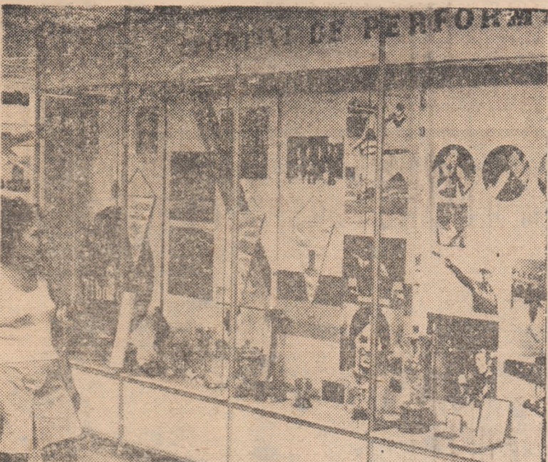
Una dintre vitrinele în care sunt prezentate trofeele obținute de sportivii români în marile confruntări internaționale.

lată un moment semnificativ și simbolic: tinerii înscriși cu trupurile lor, în Piața Aviatorilor, cifrele aniversare XXX. Trei decenii de viață liberă, prosperă și fericită, de mari înfăptuiri obținute sub conducerea partidului!