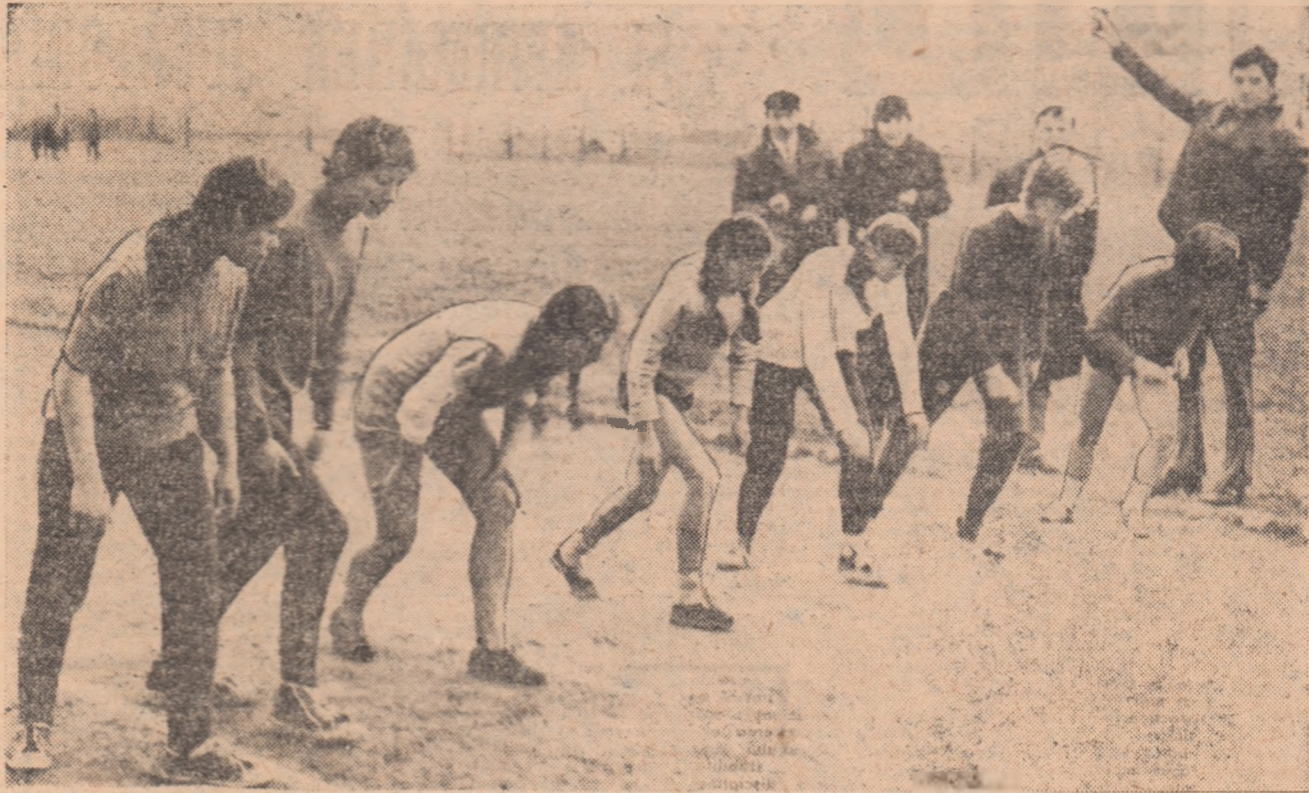
Start în proba de 800 metri a unei îndrăgite competiții de pe meleagurile județului Sălaj: „Cupa agriculturii”.