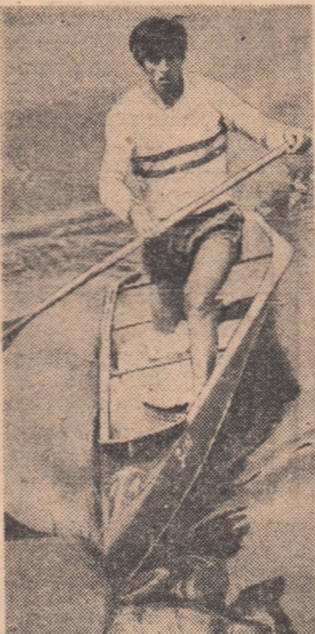
Ivan Patzaichin a adăugat, anul trecut, după finala de canoe simplu — 1000 m, o nouă medalie de aur bogatei sale colecții de trofee sportive