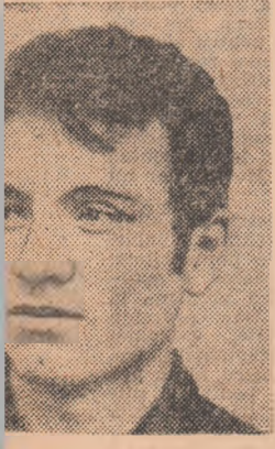
SAN (A.S.A. Tg. Mureș)