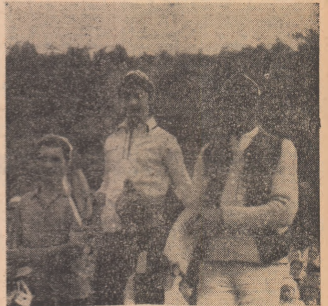
Adeseori, pe podiumul diferitelor competiții sportive de masă rezervate locuitorilor din sate și comune, urcă oameni îmbrăcați în frumoase costume populare. Un asemenea simbol elocvent al legăturii dintre tradiție și noua viață a populației rurale ne-a oferit și festivitatea de premiere din cadrul „Cupei forestierului”, desfășurată recent în județul Bistrița-Năsăud.

Aceste simple date statistice, semnificative prin ele însele, atestă faptul că educația fizică și sportul semnează o prezență vie, activă, în viața satului românesc, caracterizat în trecut prin multe concepții tradiționaliste, împietrite în obiceiuri seculare, greu receptive la nou. Se spune că gradul de civilizație al unui popor poate fi definit și prin împămîntenirea obișnuinței de a se educa din punct de vedere fizic. În momentul de față, satul românesc poate oferi un argument convingător într-o eventuală demonstrație a acestui adevăr.