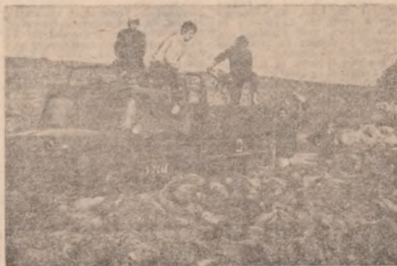
Grup de studenți lucrînd la încărcarea (descărcarea) sfeclii furajere

În vizită la I.A.S. Ciocirlia, unde studenții de la I.E.F.S. prestează muncă patriotică