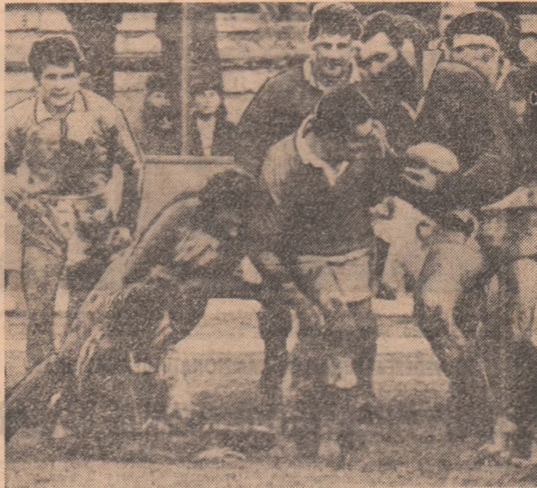
Iată un aspect de la ultima întîlnire dintre rugbyștii români și cei francezi, disputată la noi în țară, la Constanța, în 1972

Au trecut 55 de ani de cînd rugbyștii noștri i-au întîlnit pentru prima oară pe cei francezi — adevărații maeștri ai jocului cu balonul oval. A fost o încercare temerară a unui mînunchi de tineri entuziaști, cucerii de această nouă disciplină sportivă, născută în... Anglia. Inceputul a fost anevoios. Dar, de atunci, tinerii rugbyștii români, atît de dotați pentru acest sport bărbătesc,