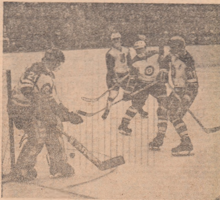
Unul dintre momentele interesante ale întîlnirii Steaua—Dinamo