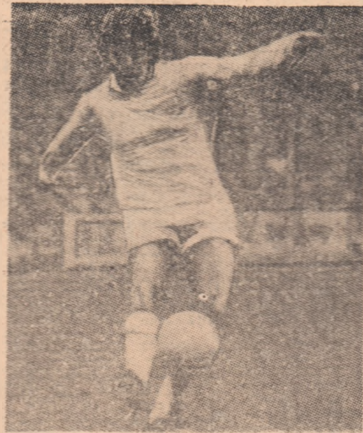
Cunoscutul atacant al lui Leeds, Lorimer, va fi sigur titular al echipei Scoției în meciul acesteia cu Spania, de la 20 noiembrie (partidă din grupa selecționatelor noastre)

● Bogat program de jocuri pînă la sfîrșitul anului