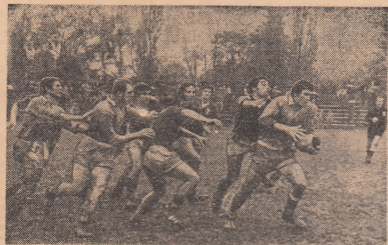
O acțiune frumoasă a înaintării cedețiilor noastre pe care tinerii rugbyști francezi nu o pot stăvili...

riu Irimescu și Ion Tuțuianu, rezultatul final, 13-3 (3-3), oglindind fidel situația din teren.