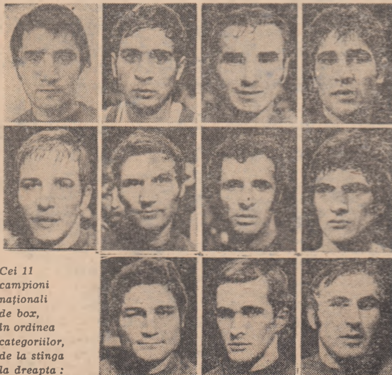
Cei 11 campioni naționali de box, în ordinea categoriilor, de la stînga la dreapta: