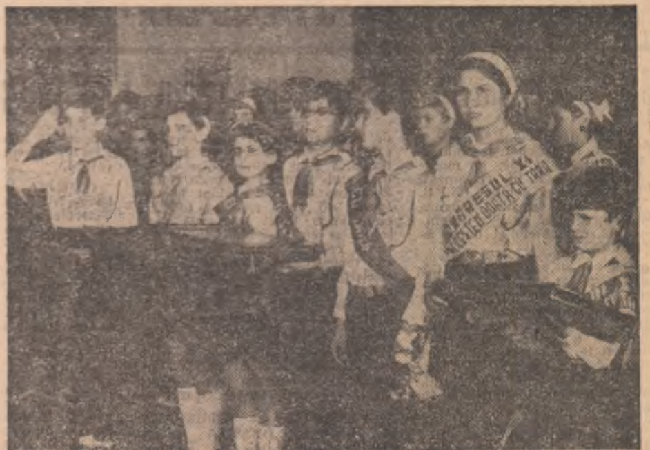
Moment de la festivitatea de primire a ștafetei.

anul 1974 culege roadele deosebite ale neprețuitului sprijin acordat de partid mișcării sportive, personal de către tovarășul Nicolae Ceaușescu. Hotărîrea C.C. al P.C.R. din februarie-martie 1973 cu privire la dezvoltarea continuă a educației fizice și sportului a întărit mișcarea sportivă, conducerea acesteia și le-a dat un impuls general remarcabil, concretizat, după aproape doi ani, cu cele mai substanțiale performanțe obținute vreodată de sportivii noștri în termen de un an. În anul 1974, an al campionatelor mondiale, sportivii români au cucerit un număr record de 30 de medalii la sporturile olimpice, înscriindu-se, într-un clasament neoficial al sumei medaliilor, pe locul al V-lea în lume, după U.R.S.S. (117 medalii), R.D. Germană (91), S.U.A. (71), Polonia (33) și înaintea R.F. Germaniei (26), Bulgariei (24), Japoniei (22), Ungariei (19), Cehoslovaciei (14), Cubei (13), Marii Britanii (13), Italiei (12), Iugoslaviei (9), Franței (6) etc.