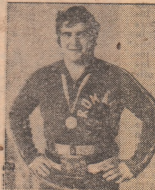
Luptătorul Ladislau Simon, campion al lumii

Situarea sportivilor români printre fruntașii întrecerilor cu caracter mondial, obținerea de succese la Jocurile Olimpice, cer o pregătire, un proces instructiv-educativ în continuă perfecționare, fundamentat pe cuceririle științelor. În lume se amplifică măsurile și mijloacele pentru creșterea numărului de talente autentice, se pune un accent tot mai mare pe aportul inteligenței (o expresie a acestei tendințe fiind dirijarea de tehnicieni către diferite specialități: antrenor, medic, psiholog, biolog etc.), pe îmbunătățirea și modernizarea mijloacelor tehnice. În acest context, pregătirea sportivilor români pentru Jocurile Olimpice din 1976 și-a propus —