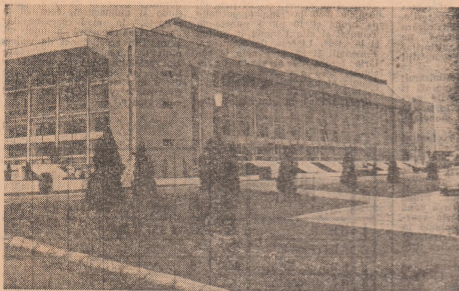
Palatul Sporturilor și Culturii, dar de preț făcut mișcării noastre sportive

Beneficiind de o vastă experiență, de o documentare în permanentă îmbogățire, de sprijinul celorlalte științe, antrenorii și tehnicienii însărcinați să realizeze Programul de pregătire pentru Jocurile Olimpice din 1976 au la dispoziție tot ce le este necesar pentru a fructifica talentul sportivilor, pentru a-i ajuta să urce pe cele mai înalte trepte ale măiestriei sportive. Acești doi ani au scos în evidență potențialul general crescut al sportului nostru, dar au reliefat și rezerve încă neexploatate suficient. Timpul care a mai rămas până la J.O. trebuie folosit tot mai mult pentru obținerea randamentului maxim.