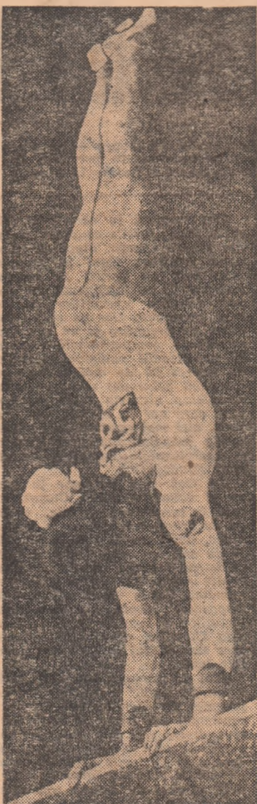
Anul 1975 va marca debutul oficial al tinerei speranțe a gimnasticii românești, Nadia Comăneci