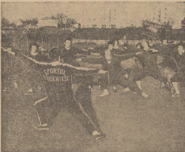
Ieri după-amiază, la primul antrenament din acest an, susținut pe terenul propriu, componenții formației bucureștene Sportul studențesc au dovedit foarte multă voință.