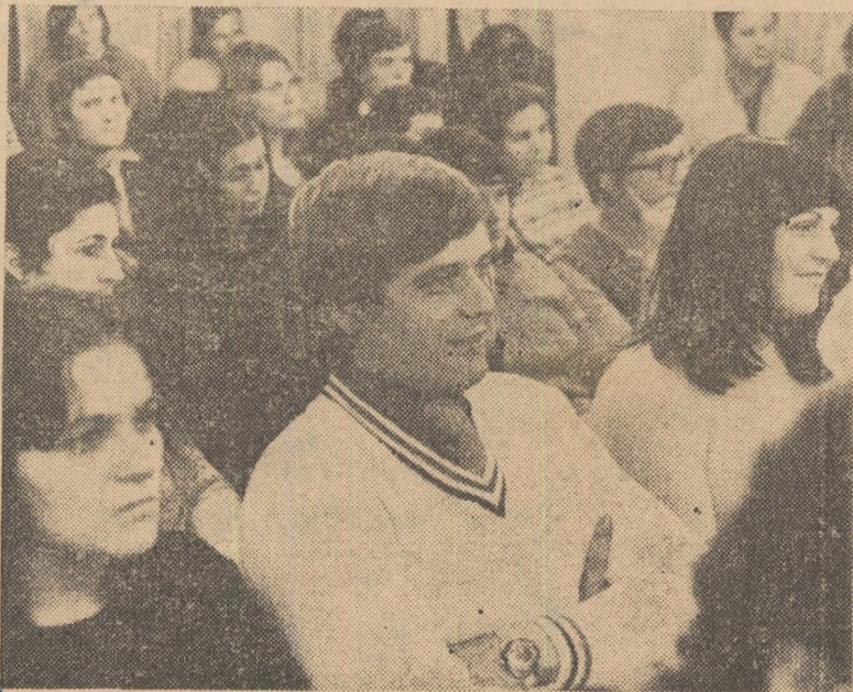
Aspect din sală. În centrul imaginii: dublul campion olimpic Vasile Diba

ve permanente, pentru ca la Jocurile Olimpice 1976 să ne putem prezenta cu loturi omogene, valoroase, capabile să concureze cu