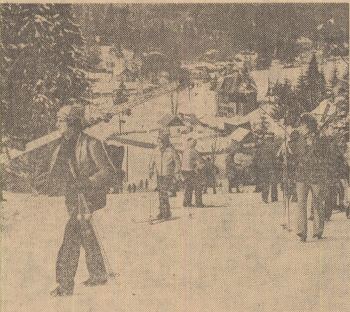
Zăpada bogată căzută în zonele de munte oferă amatorilor de a practica sporturile de iarnă condiții excelente. Ca atare, fiecare sfîrșit de săptămînă înregistrează mii de tineri și tinere care urcă pe munte pentru a schia. Imaginea de mai sus, surprinsă la Predeal de fotoreporterul nostru Dragoș Neagu, este grăitoare

Azi și miine, la hochei, derbyul STEAUA — DINAMO