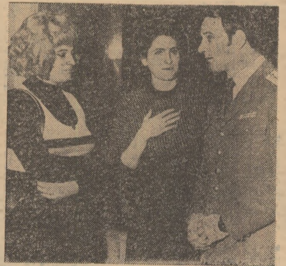
În pauză, sportivii frunțași își împărtășesc impresii, își expun planurile de viitor.

Înarmat cu un document de o asemenea forță, sportul românesc pornește pe un drum nou, mult mai pretențios, dar tocmai de aceea deosebit de frumos și de ispititor. La Conferință a fost acceptată de toți ideea că în actualul moment se pune mai ales întrebarea cu ce unități trebuie să măsurăm progresele înregistrate? Părerea unanimă a fost că scara pe care plasăm succesele noastre, etalonul pe care îl vom folosi, nu pot fi decît cele raportate la nivelul internațional, cel mondial!