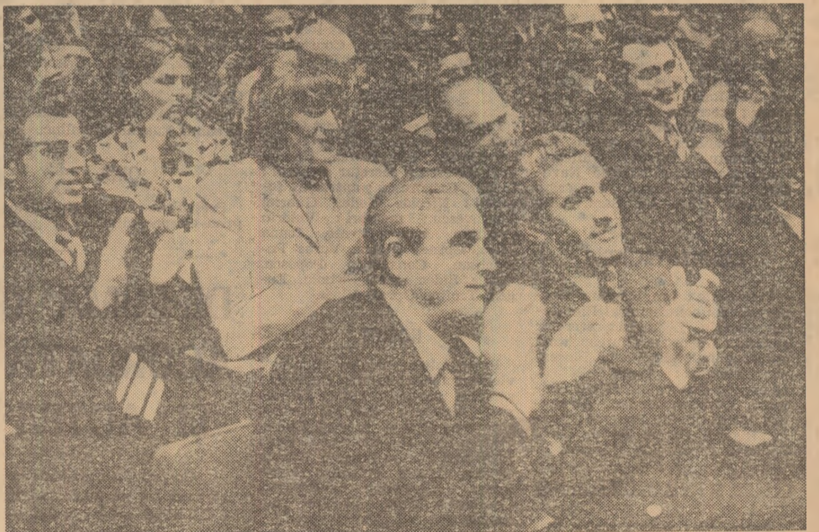
Participanții la Conferință urmăresc cu interes dezbaterile

În continuare, a fost supus la vot și aprobat de către delegații la Conferință Raportul de activitate al Consiliului Național pentru Educație Fizică și Sport pe perioada iulie 1967 — februarie 1975. Au fost, de asemenea, aprobate proiectul Programului de dezvoltare a activității de educație fizică și sport din Republica Socialistă România pe perioada 1975—1980 (proiect care urmează a fi definitivat și adoptat la viitoarea