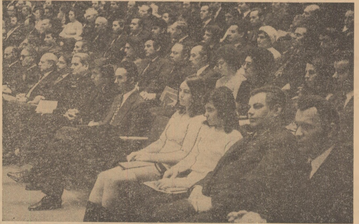
Delegații și invitații ascultă cu atenție telegrama adresată de Conferința pe țară tovarășului NICOLAE CEAUȘESCU

tovarășe Nicolae Ceaușescu, că își vor consacra toată energia, întreaga capacitate și pasiune traducerii în viață a sarcinilor și indicațiilor cuprinse în strălucitul mesaj adresat Conferinței, în celelalte documente programatice ale partidului și statului, contribuind astfel — alături de ceilalți oameni ai muncii din patria noastră, tineri și vîrstnici, bărbați și femei, români, maghiari, germani și alte naționalități — la îndeplinirea programului de făurire a societății socialiste multilateral dezvoltate în patria noastră, la ridicarea României pe noi culmi de progres și civilizație.