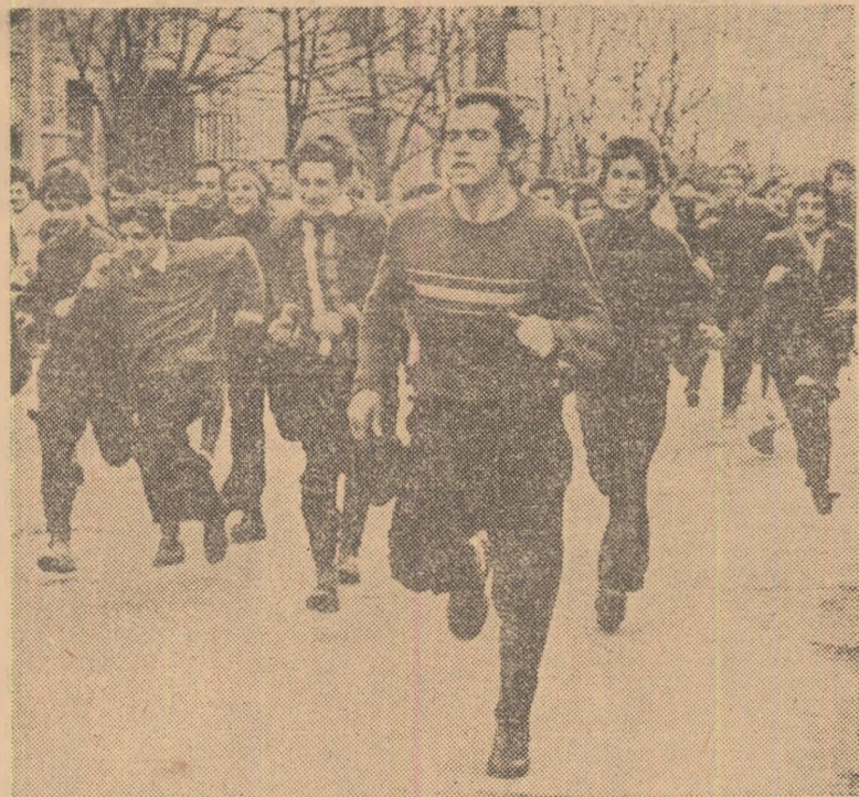
Start în crosul de masă organizat ieri după-amiază în sectorul 8 din Capitală, în întipinarea algerilor de la 9 martie.