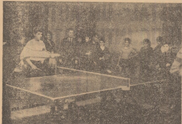
Intrecere de tenis de masă preilejuită de „Duminica sportivă școlară“ organizată cu puțin timp în urmă de C.E.F.S. al Sectorului 6.

elevei de la școlile generale 115, 122, 124, 129, 146 și 150; baschet — competiție la startul căreia se vor alinia reprezentanții unui număr de 5 școli generale și licee; tenis de masă, tir cu aer comprimat, șah, volei și orientare turistică. Se estimează prezența a peste 3 000 de elevi la această interesantă manifestare sportivă de masă.