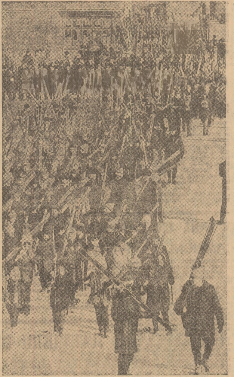
Tineretul iubeste sportul! Trebuie doar ca, pretutindeni, factorii cu raspundere in domeniul educatiei fizice si sportului sa dovedeasca pasiunea si priceperea activistilor sportivi din Cimpulung Moldovenesc, initiatori ai traditionalului „Festival al sporturilor de iarna”