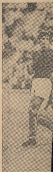
Miine, chiar în documentul nost

O altă optică decît aceasta este dăunătoare, poate deveni o frînă. Urînd, deci, succes deplin celor 18 echipe care reîncep azi și miine cursa campionatului, adresăm această urare nu fiecareia în parte, ci întregului nostru fotbal și exponenții sale numărul 1, echipa reprezentativă.