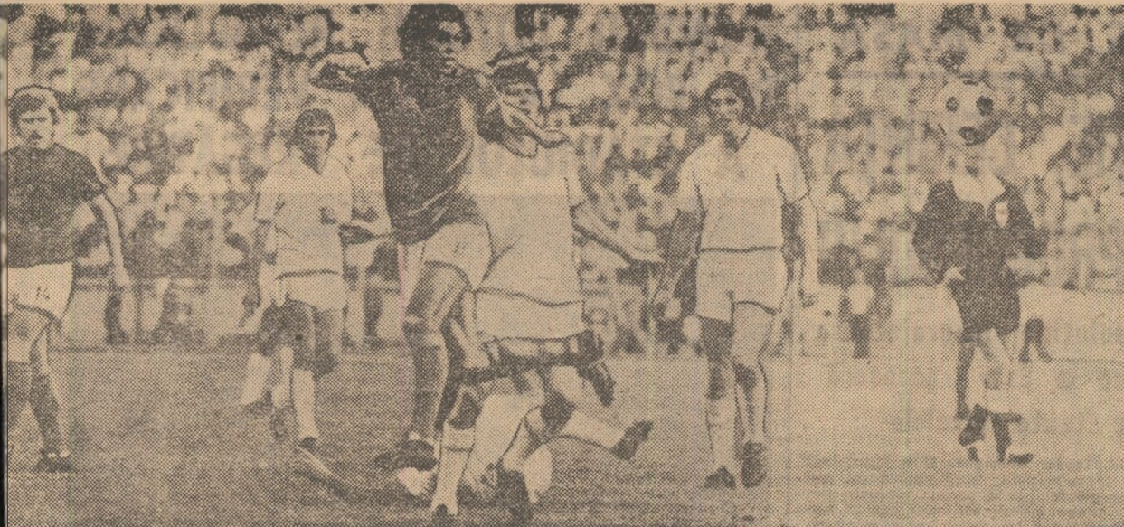
La returnului se dispută un derby mult așteptat: meciul F.C.M. Reșița (locul 2) — Dinamo (locul 1). În un aspect din partida tur, disputată, în toamnă, la București.