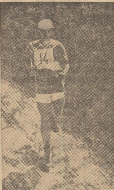
Pe traseul concursului de orientare turistică

— Inceput cu anul 1975, la cuple și concursurile județene s-au prevăzut mai multe probe de noapte și de iarnă. Numărul cupelor nominalizate de federație a rămas, în general, același, dar în desfășurarea lor vor interveni schimbări. Astfel, hărțile vor fi în culori și reambulate în totalitate, nu numai în zonele posturilor. Se vor folosi mai mulți arbitri locali, care cunosc zonele. Cât privește aceste zone, ele vor fi mai judicios așezate, de pe întreg teritoriul țării, iar plecările și sosirile în curse vor fi amplasate în puncte ușor accesibile. Ținând cont de prețioasa indicație cuprinsă în Mesajul adresat de tovarășul NICOLAE CEAUȘESCU, participanților la Conferința pe țară a mișcării sportive privind cuprinderea și antrenarea întregului tineret în practicarea exercițiilor fizice, a sportului și turismului, vom acționa astfel încât orientarea turistică să devină, pe drept cuvânt, un sport de masă, practicat de întregul tineret, pentru fortificarea sa fizică și pentru pregătirea sa în vederea