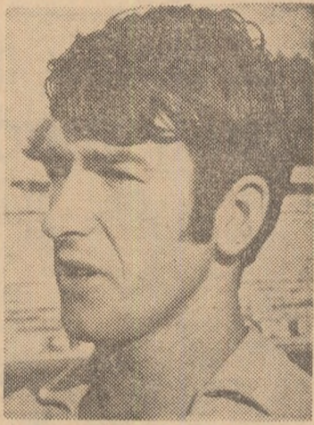
OPREA (Șoimii Sibiu)

...În tribunele stadionului „23 August” din Capitală au venit simțind trecută multă dintre simpatizanții clubului Rapid, încurajând forța necesară să depășească momentul critic și astfel să poată înscrie — tot el! — punctul egalizator.