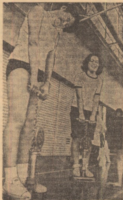
În sălile de gimnastică ale universităților japoneze, studentele își dezvoltă, prin diverse exerciții, capacitatea fizică

rit și agilitatea întrec adesea puterea fizică, a trecut de mult hotarele Japoniei, unde s-a născut, devenind un sport de mare atracție pentru tineret, ba chiar (din 1964 încoace) disciplină olimpică, în care maștrilor care l-au creat le vine tot mai greu să obțină înțelegerea față de propriii lor elevi. Printre sporturile tradiționale se mai numără: lupta sumo, kendo (un fel de scrimă cu bețe de bambus despicate), yabusame (un tir cu arcul evestru, practicat la Kamakura) și alte.