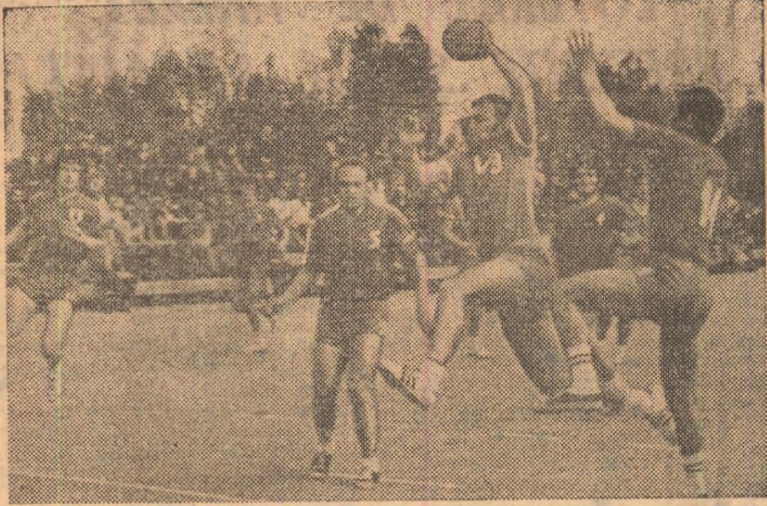
Moldovan (Dinamo) pătrunde impetuos pe lângă Bera și va puncta pentru formația sa. Fază din jocul Dinamo București — CSU Galați