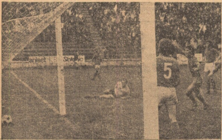
Așa s-a înscris primul gol al Stelei: mingea șutată de Răducanu (în planul mai îndepărtat al imaginii) a lovit bara și apoi a poposit în plasă.