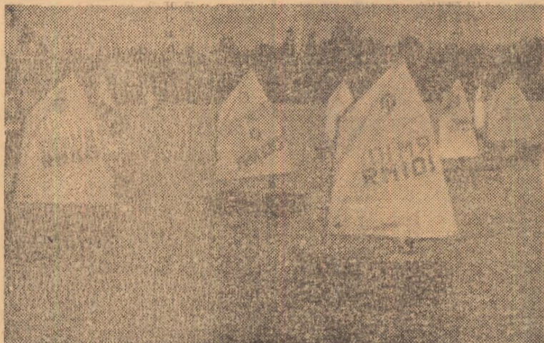
Pe apele lacului Herăstrău, o frumoasă „Paradă a ambarcațiunilor”