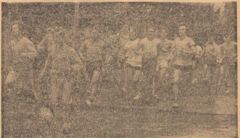
Numerosi tineri s-au întrecut într-o atraktivă competiție de cros.

Așadar, în Capitală, ca și în întreaga țară, prin laudabilele strădanii ale organizatorilor au fost inițiate numeroase acțiuni și manifestări sportive cu o largă parti-