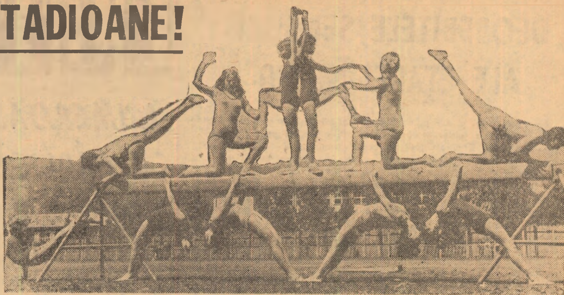
Ansamblu de gimnastică realizat de elevele Liceului nr. 2 din Baia Mare

(Din Mesajul adresat de tovarășul NICOLAE CEAUȘESCU participanților la Conferința pe țară a mișcării sportive)