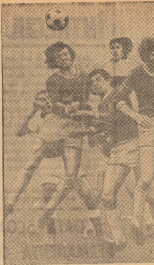
Un trio de fundași sătmăreni a alcătuit parcaștarului Bathori I. Fază din meciul Sportul studentesc — Cluj-Napoca, joi, în Capitală. Putat astă-toamnă în Capitală.

● JUUL — POLITEHNICA IASI. Formația din Petroșani a efectuat antrenamente zilnice. Joi, un joc cu divizionara C. Minerul Lupeni (arbitrat de antrenorul Ion Ionescu și, deseori, întrecut de fluierul acestuia, pentru repetarea unor faze) a însemnat și definitivarea forma-