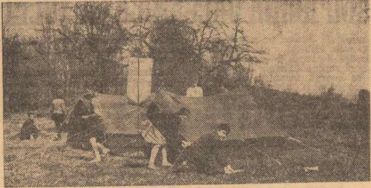
Se înalță corturile la Voineasa... Tabăra prinde contur. În curînd, pădurea va răsună de cîntecele și risetele copiilor