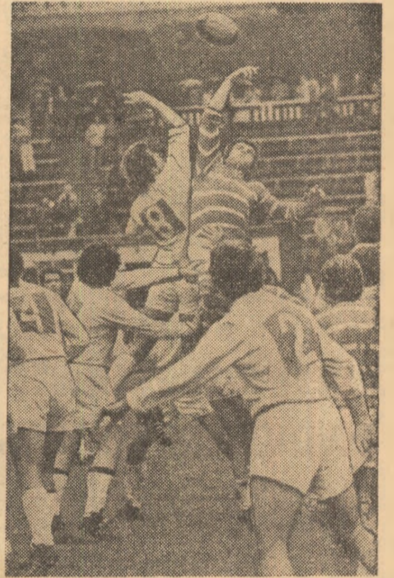
Duel aerian la o repunere de la margine între Boroi și Dărăban (8). Fază spectaculoasă din întîlnirea Dinamo — Farul (6-6)